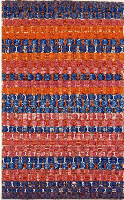
Anni Albers. Red and Blue Layers, 1954. Coton, 61,6 x 37,8 cm. The Josef and Anni Albers Foundation.