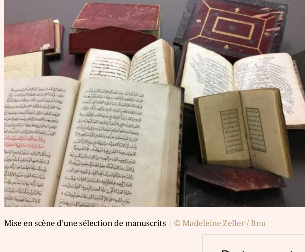
Mise en scène d'une sélection de manuscrits