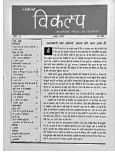
जन विकल्प के कवर पेज। पत्रिका के कुल 11 अंक प्रकाशित हुए, जिनमें से एक अंक साहित्य वार्षिकी के रूप में छपा।