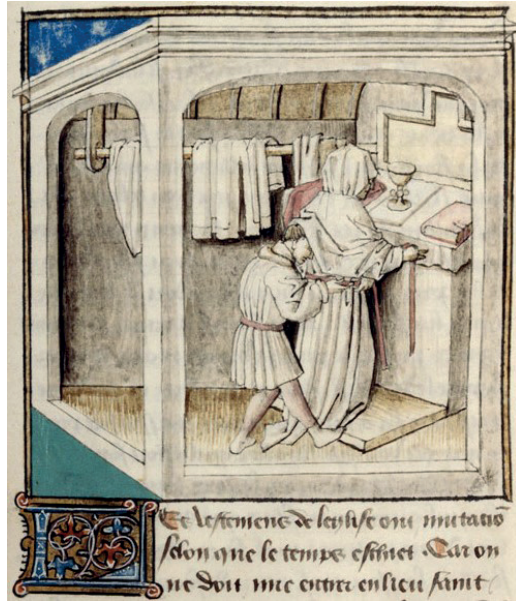
Fig. 3 | Habillement du célébrant dans la sacristie, enluminure dans le Rational des divins offices , ca. 1450, fol. 50. Beaune, bibliothèque Gaspard Monge, ms. 21.

difficile à interpréter 59 . Le deuxième livre porte à la rubrique de l'évêque une enluminure présentant vraisemblablement l'habillement du célébrant, tandis que le début du troisième livre sur les vêtements montre un évêque en prière. Il semble qu'il faille considérer cette inadéquation comme une simple inversion. L'iconographie de l'habillement n'en est pas moins surprenante, puisqu'elle montre un clerc debout devant un autel nappé et entouré de courtines, positionnant sur sa tête le premier vêtement sacerdotal : l'amict (fig. 4) 60 . Pamela Nourrigeon décrit en ces termes cette enluminure : « Une femme, tête voilée, se trouve devant l'autel que deux diacres entourent » 61 .