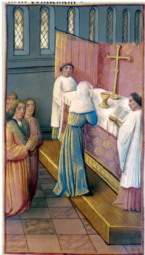
Fig. 4 | Habillement du célébrant à l'autel, enluminure, dans Rational des divins offices, réalisé pour Antoine de Bourgogne (1421-1504), fol. 72. Paris, Arsenal, ms. 2001.

Cette interprétation nous semble inappropriée. Il est difficile d'imaginer qu'une femme puisse se tenir si près de l'autel, à la place du célébrant, dans un commentaire liturgique. Le « voile » qui couvre la tête de ce personnage est un amict qui n'a pas encore été repoussé à l'arrière de la nuque pour former un col. On voit d'ailleurs dépasser un cordon devant la poitrine de ce personnage, qui ne peut être qu'un célébrant en vêtement talaire. L'habillement n'est pas assisté et aucun insigne pontifical n'est exposé sur l'autel. En revanche l'autel est