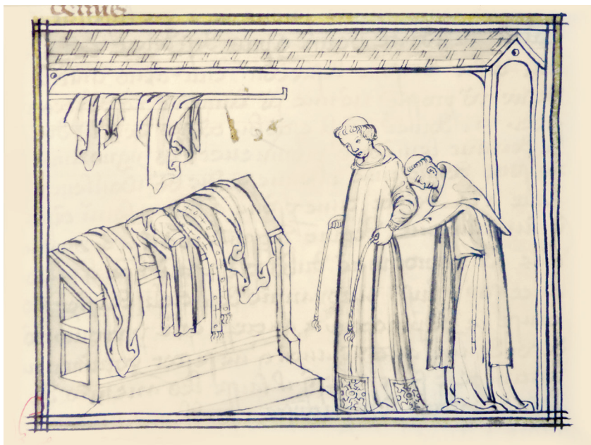
Fig. 2 | Habillage du célébrant dans la sacristie, enluminure dans le Rational des divins offices, 1371-1380, fol. 31v. Paris, Arsenal, ms. 2002.

le lieu de l'habillement dans la sacristie, elle donne à choisir entre une simple table et un autel. Par la suite, les copies de cette enluminure présentent les deux possibilités 57 . Au xv e siècle, une autre formulation iconographique donne encore cette alternative 58 . Au Moyen Âge tardif, des autels peuvent tout à fait prendre place dans les sacristies et contribuent déjà à sacraliser l'habillement du simple prêtre (voir par exemple fig. 3).