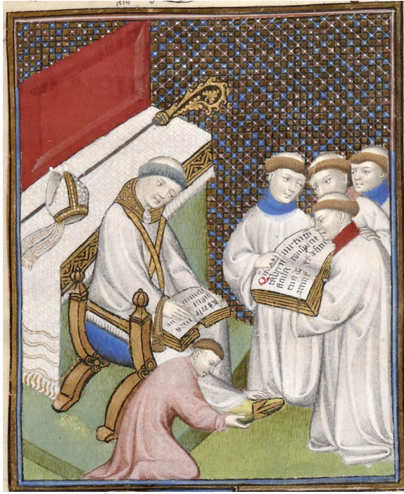
Fig. 1 | Évêque se revêtant à l'autel de la célébration (enluminure), dans Missel-Pontifical de Luçon , XIV e siècle, BNF, lat. 8886, fol. 88.