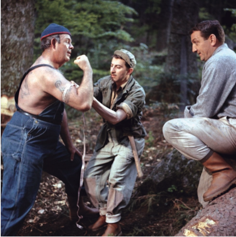
© P. Giovanni / P. Enrico