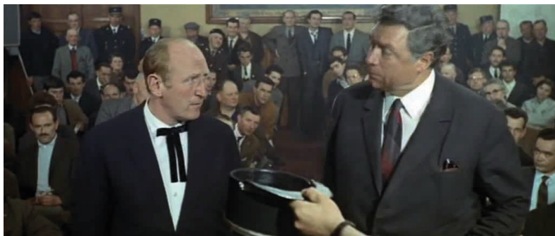
© P. Giovanni / P. Enrico : Les grandes gueules

La première expérience d'informatisation des ventes de bois a eu lieu le 13 novembre 1996. Elle fut organisée par des propriétaires privés (Union des Forêts de Bourgogne & le groupement des experts forestiers de Bourgogne). Du côté de la forêt publique, les premières tentatives n'ont débuté qu'à partir des ventes d'automne en 2008. Progressivement, les unités territoriales de l'ONF ont cherché à imposer l'informatisation de la procédure d'adjudication sur soumissions, l'enchère descendante reposant toujours quant à elle sur une annonce orale des tarifs par l'intermédiaire d'un crieur. En effet, étant donné la contrainte majeure de l'ONF d'avoir un dispositif mobile adaptable à différents lieux de vente, la solution technique retenue a été celle du boîtier électronique sur lequel les enchérisseurs saisissent des offres transmises par voie hertzienne au directeur de vente. Grâce à ce dispositif portatif qui possède la forme d'un terminal de paiement, il est possible pour l'ONF d'organiser des ventes dans n'importe quelle salle des ventes. Or, cette solution a pour inconvénient d'être moins rapide en matière de transmission d'information que dans les systèmes reliés par câble. De plus, le système ne permet pas de garantir, selon le placement dans la salle, la même vitesse de transmission, rendant impossible l'idée d'utiliser le boîtier dans les enchères au rabais où le lot est adjudgé au plus rapide. D'où la décision de