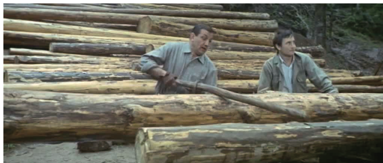
© P. Giovanni / P. Enrico : Les grandes gueules

À ce titre, la décision récente de l'ONF d'abandonner dans l'avenir la procédure du rabais pour ne conserver que celle des adjudications sur soumissions, au motif que la première est devenue « archaïque », démontre que le rapport de force tourne, du fait de l'introduction du boîtier électronique, à l'avantage du vendeur. Cependant, l'opposition