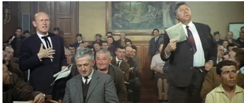
© P. Giovanni / P. Enrico : Les grandes queues