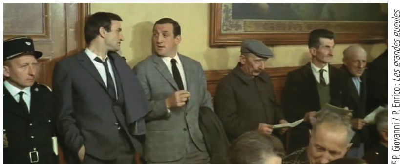
© P. Giovanni / P. Enrico : Les grandes gueules

À première vue, on pourrait être tenté de croire que la place occupée par les acheteurs de bois publics dans la salle des ventes n'obéit à aucune logique particulière et n'exerce aucune influence sur le résultat de l'enchère. Cependant, il ressort de nos observations que le positionnement sur la scène marchande résulte, pour les acheteurs, d'un arbitrage