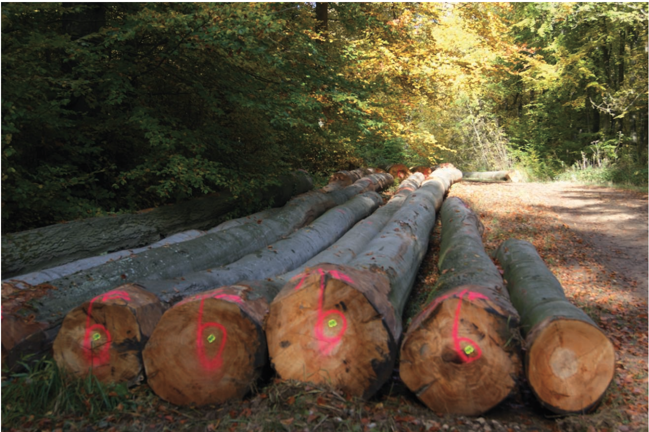
Lots de hêtres façonnés « bord de route » en forêt domaniale de Haye. Le travail de façonnage a été réalisé par l'ONF. Le bois acheté aux enchères n'a plus qu'à être prélevé en bordure du chemin forestier par l'acheteur.

rencontrée sur le terrain de la part d'acheteurs, jugeant la disparition de cette procédure inacceptable tant celle-ci fait partie de la tradition forestière, rappelle que le débat n'est jamais vraiment clos. Gageons que l'étude de l'évolution des choix de procédures dans les prochaines années nous permettra de voir si la volonté de l'ONF s'est durablement imposée ou si, comme dans les années 1990, alors que la décision d'abandonner l'enchère au rabais avait été prise une première fois, l'ONF était, sous la pression des acheteurs, revenu sur son choix en réhabilitant cette procédure.