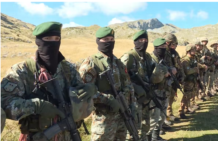
Entrenamiento militar en Sinjajevina.