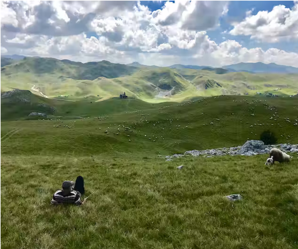
Las tierras altas de Sinjajevina (Montenegro). Petar Glomazic, Author provided