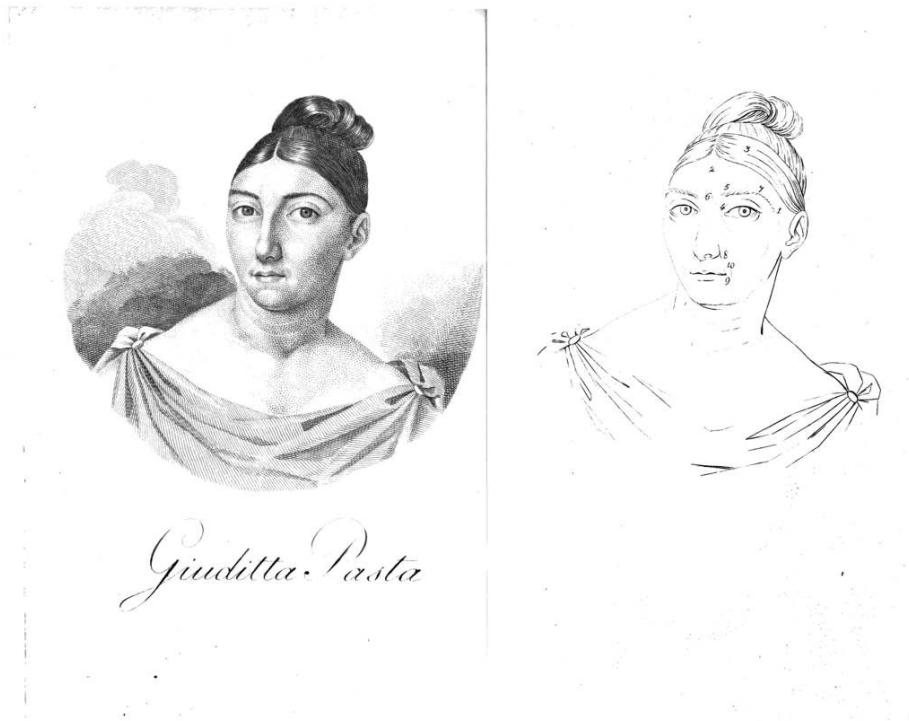
Fig. 1. Giuditta Pasta , gravures sur bois de bout insérées avant la page de titre, 18,7 x 12,8 cm, [1830 ?], dans L. MORANDO DE RIZZONI, La Pasta nell'Otello, dialogo del nob. dottore Luigi Morando De Rizzoni , Vérone, Crescini, 1830.