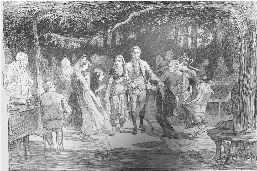
Illustration from “A Mad Bridal: Strange Experiences Among Palermitan Lunatics”, in The Illustrated American (11 July 1891), p. 359

Source: Google Books, https://books.google.fr/ Willis is not credited, and the story is published anonymously.