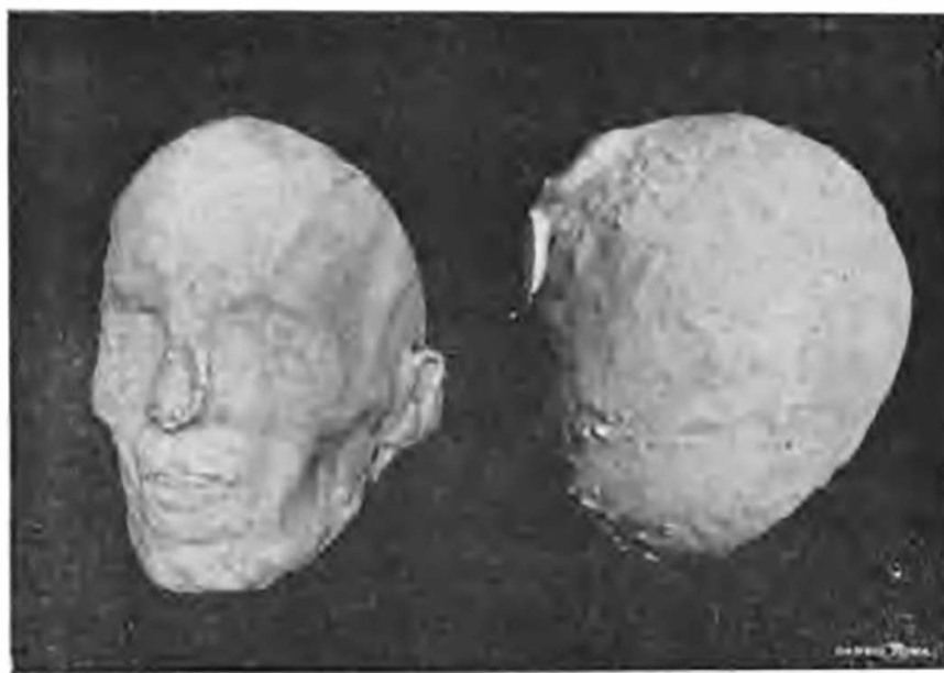
MASCHERA E CRANIO PRESI NEL 1876

«Maschera e cranio presi nel 1876», Omaggio a Bellini nel primo centenario dalla sua nascita , a cura del Circolo Belliniano di Catania, Catania, Giuseppe Russo, 1901, p. 294.