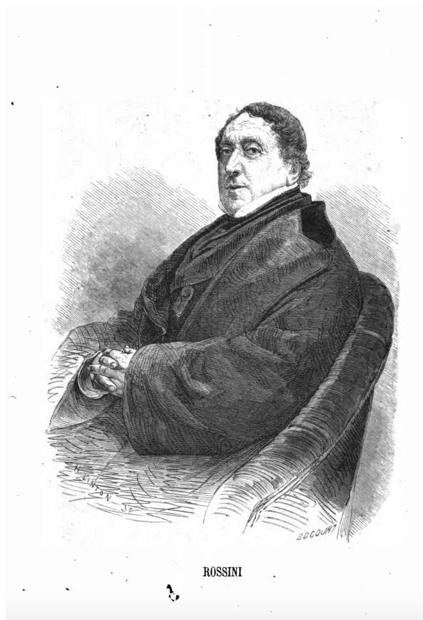
Fig. 2 : MARIE-FIRMIN BOCOURT, Rossini , Paris, Typ. A. Bourdillat, in Les grands et les petits personnages du jour par un des plus petits. Scènes d'intérieur de nos contemporains , Paris, Poujau de Laroche, 1860.

Reste que dans cette « scène d'intérieur », la satire se joue essentiellement autour de la glotonnerie, ainsi présentée comme le revers du génie rossinien. Car il ne s'agit pas ici d'annuler ce génie, mais de montrer comment il cohabite avec d'autres qualités moins louables. C'est tout le but de cette série : partant du principe qu'il n'y a « pas de grands hommes pour leurs valets de chambre », le prospectus promet d'ailleurs force « détails minutieux » et « petites anecdotes » censés peindre leur caractère et « les montr[er] avec leurs habitudes et leurs faiblesses » 34 .