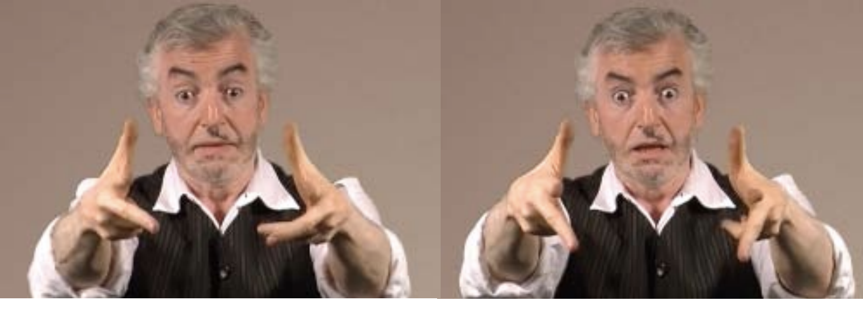
Figure 4. Expression faciale aspect ponctuel : petite explosion des lèvres et grande ouverture des yeux. Images de Nasreddine Chab - conte titre: Thomas et la lanterne magique . Production CNAM (Musée des arts et métiers Paris).