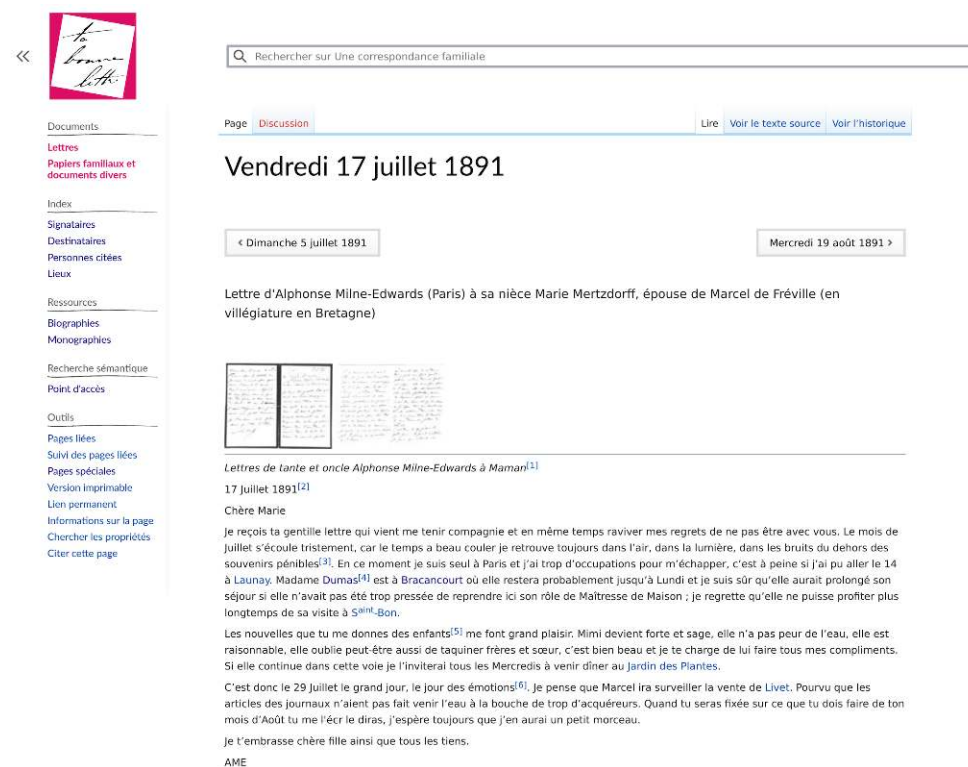
FIGURE 1A. VUE PARTIELLE DE LA LETTRE « VENDREDI 17 JUILLET 1891 » : RENDU HTML SUR NAVIGATEUR

Chaque document – lettre, biographie, monographie ou papier – est représenté par une page unique sur le wiki, identifiée par son titre. Les textes sont formatés en wikicode. Par conséquent, le rendu HTML des pages diffère significativement de leur texte balisé. La figure 1a présente la vue de la lettre intitulée « vendredi 17 juillet 1891 6 » et, en dessous, la figure 1b, un extrait du texte brut du document contenant les balises de mise en forme wikicode.