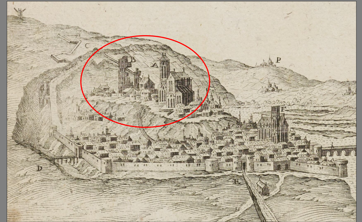
Fig. 2 : Ruines du donjon et église Saint-Nicolas sur le versant de l'Hautil d'après C. Chastillon, éd. 1644.