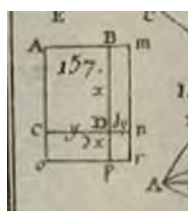
FIGURA 2b. Figura 157 de Paulian (1768)

senyar el càlcul. Així doncs, l'anàlisi comparativa d'altres conceptes, com les diferències d'ordre superior, les tangents i la determinació de màxims i mínims, podrà aportar llum sobre quina era la pedagogia «acceptada» del càlcul que els comentaris de l' Analyse presenten.