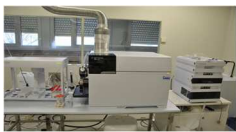
Figure 2 : Couplage chromatographie liquide - détecteur élémentaire ICP-MS (Institut Chevreul : Fédération de Recherche CNRS - Lille FR2638)