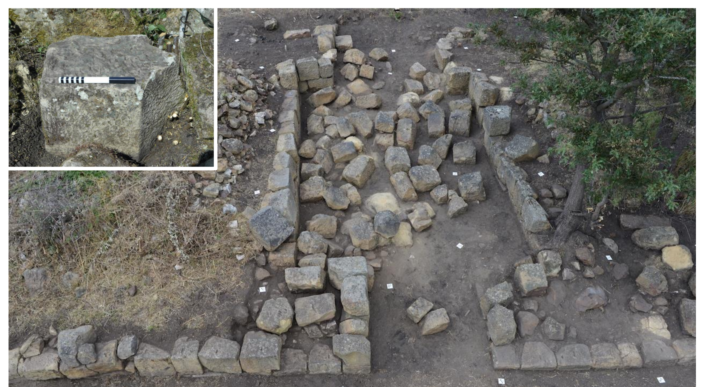
Fig. 4. La porta principale dell'insediamento, la c.d. Porta Marie: foto dall'alto con crollo in situ nella parte centrale e (in alto a sinistra) blocco forse relativo alla chiusura a volta.