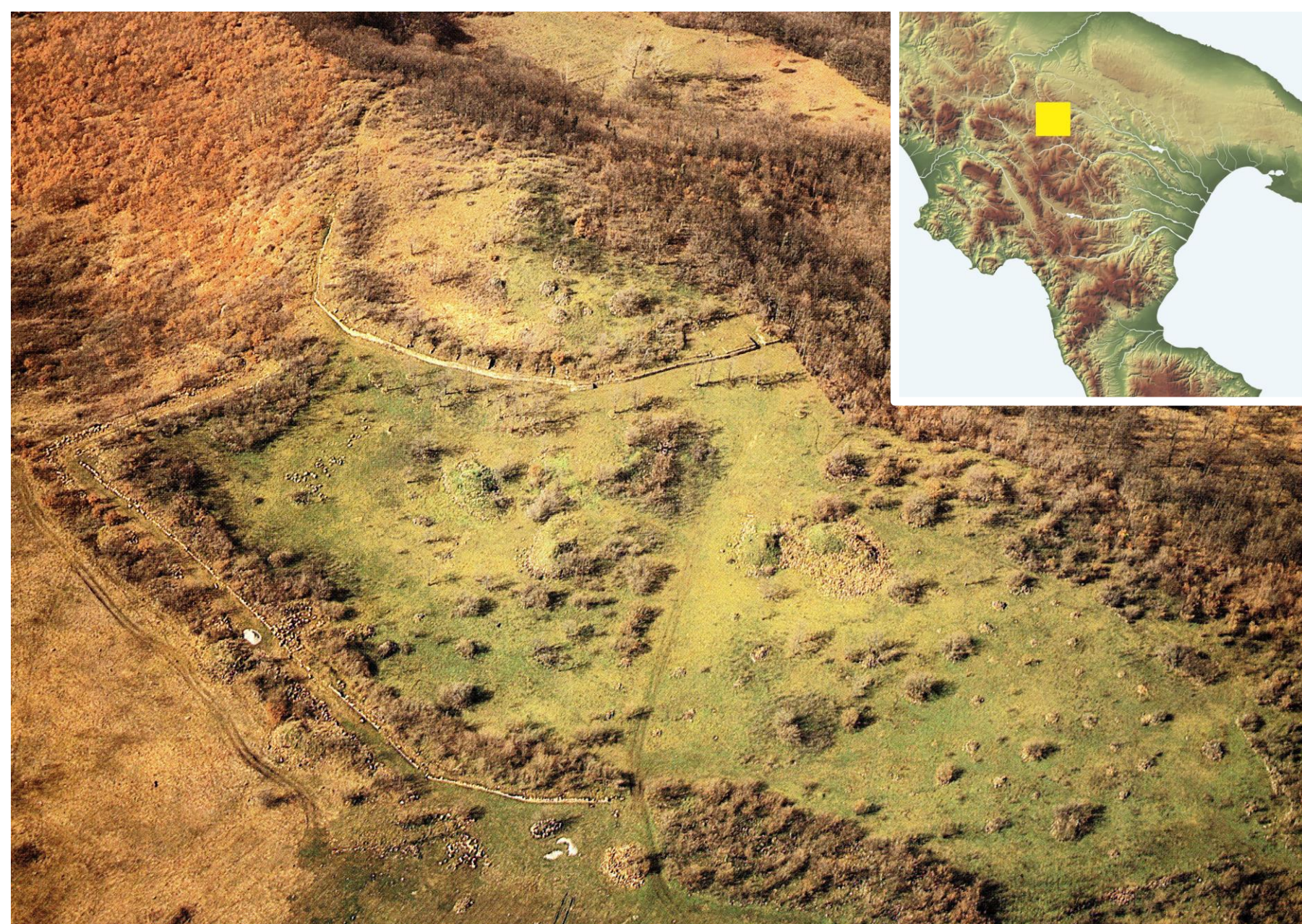
Fig. 1. Monte Torretta: foto aerea (anni '90) e localizzazione generica