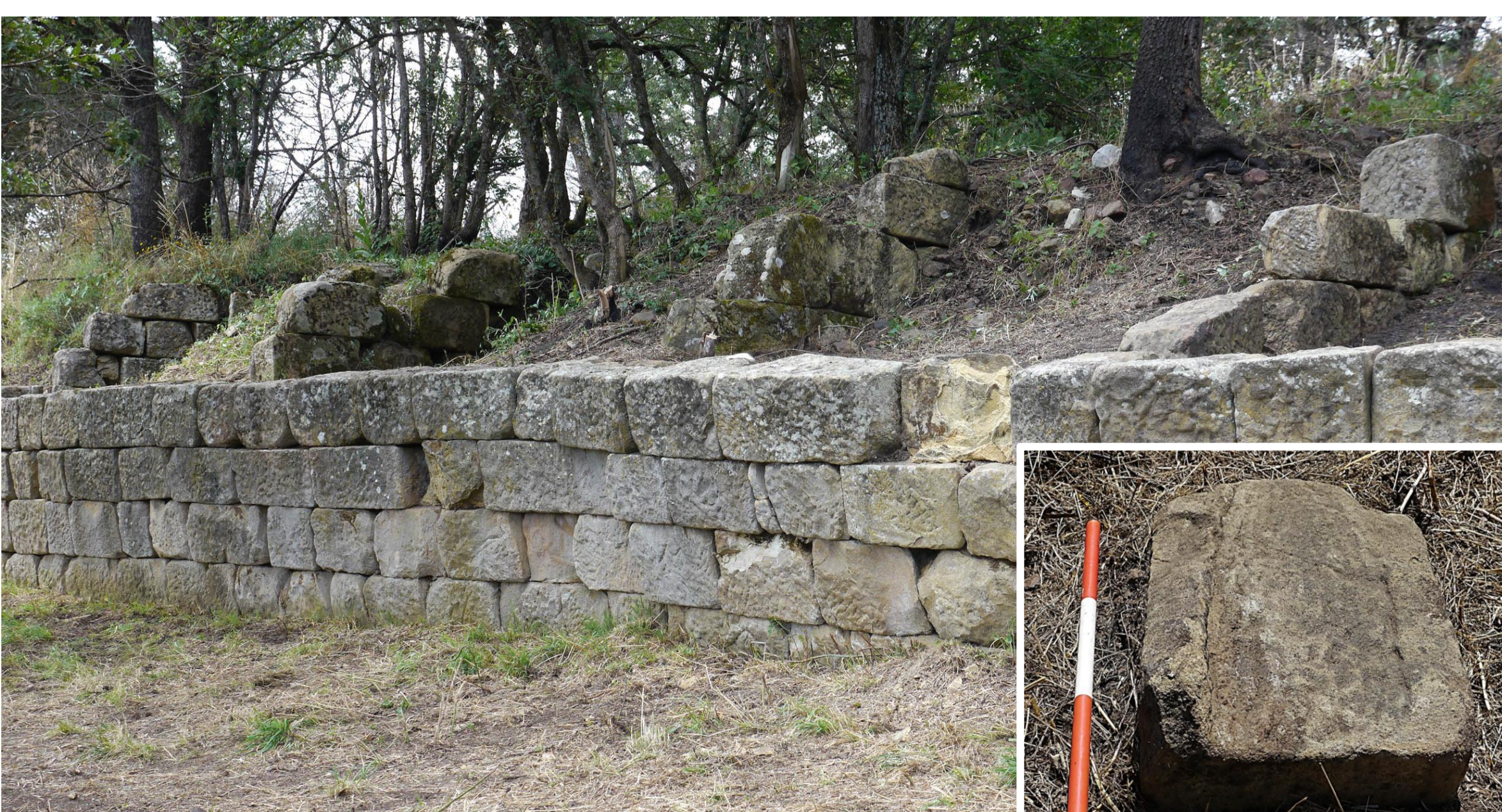
Fig. 3. Muro dell'Acropoli: dettaglio dell'alzata e delle catene murarie retrostanti; (in basso a destra) particolare di un blocco lavorato a mo' di doccione.

La campagna di quest'anno ha riportato alla luce anche la porta principale dell'insediamento, la c.d. Porta Marie . Se a livello planimetrico si rivela analoga ad altre porte a cortile già note nella regione, sorprende invece il suo stato di conservazione: nonostante il crollo ancora presente si può ricostruire un alzata di circa 2 m, mentre uno dei blocchi qui rinvenuti suggerisce di ipotizzarne una chiusura a volta. Nonostante la fase iniziale della nostra ricerca e prima ancora di avviare delle operazioni di scavo, è chiaro che il sistema di fortificazione di Monte Torretta comincia a segnalarsi come una delle principali fonti di informazione per la conoscenza dell'architettura militare in Basilicata e più in generale in Italia Meridionale.