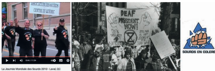
Figure 6 – A, Main et pouce levés, JMS | B, Dessin poings, Remembering DP | C, Logo de Sourds en colère

Au-delà des formes linguistiques écrites, on note d'autres usages graphiques tels que les dessins, l'utilisation régulière des symboles des mains, des poings levés, et notamment l'exploitation de la relation entre les signes saillants et leur représentation graphique libre ou plus stylisée à travers les logos des associations, par exemple (Fig. 6).