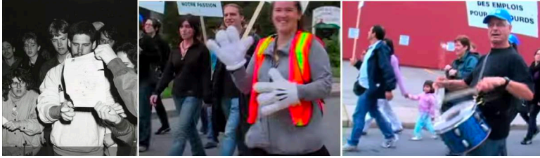
Figure 8 – A, Document d'annonce de la présidence entendante de Gallaudet, Remembering DPN | B, Gants blancs, JMS 2010, Laval au Québec | C, Tambour et accessoires bleus, JMS 2010

L'exploration des supports variés des slogans ou qui leur sont associés, et qui mobilisent différents sens et facultés motrices, sont autant d'illustrations d'une grande circulation entre les langues et les modalités. Les communautés sourdes peuvent ainsi attirer le regard vers ce qui fait leur spécificité, comme « peuple de l'œil », tout en préservant ce qui fait sens pour les communautés non signeuses : le recours à l'écrit dans la langue majoritaire, au graphisme et aux symboliques partagées.