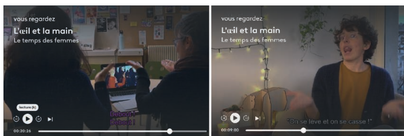
Figure 2 – [SE-LÈVE] « on se lève » ou « debout » : A, L'Hymne des femmes | B, Contestation des Césars 26

Un troisième exemple est illustré en Figure 2A par le signe [SE-LÈVE] dans une traduction en chansigne LSF de L'Hymne des femmes (créé par un collectif de femmes en 1971) et en Figure 2B dans l'interprétation en LSF de la formule prononcée d'abord par Adèle Haenel, puis reprise par Virginie Despentes, à l'occasion de la cérémonie des Césars en 2020 et en réaction à l'attribution d'un prix à Roman Polanski : « on se lève, et on se casse ».