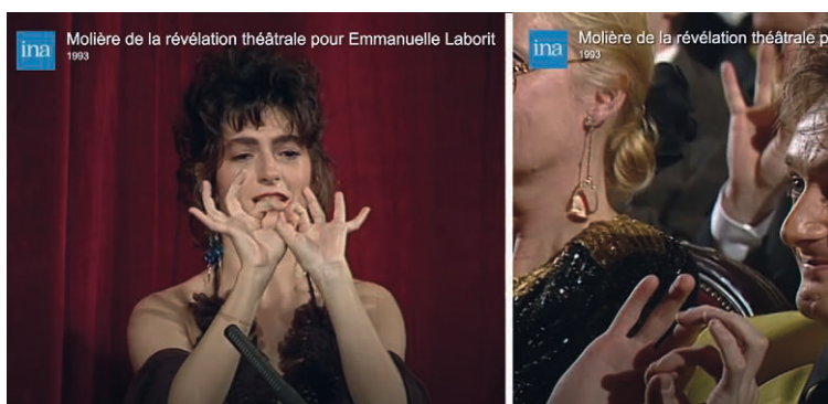
Figure 1 – Emmanuelle Laborit demande au public de faire avec elle le signe [UNIS] 25

importants, avec ou sans leader identifiable. Un autre exemple est celui du signe LSF [UNIS] (Fig. 1A-B) que la comédienne Emmanuelle Laborit a fait reprendre au public lors de la remise de son prix (Molière) en 1993. Ce signe est présent dans d'autres performances relevant de la harangue, ou du « cri » de foule.