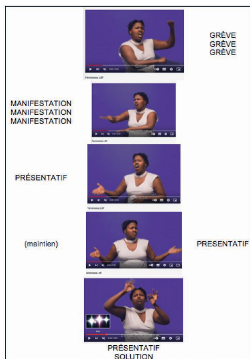
Figure 4 – Construction équilibrée d'un slogan en LSF pour la défense du climat 30

Ces patrons rythmiques qui contraignent l'organisation du discours sont bien décrits dans le genre à débit réglé et concernent aussi bien les slogans, les parties de discours scandées ou les formulettes enfantines ; ceci est valable pour les langues parlées 28 comme pour les langues des signes 29 . La régularité du rythme est assurée par la répétition dans le temps : répétition de mouvements accentués, répétition de signes, de formules, voire de refrains.