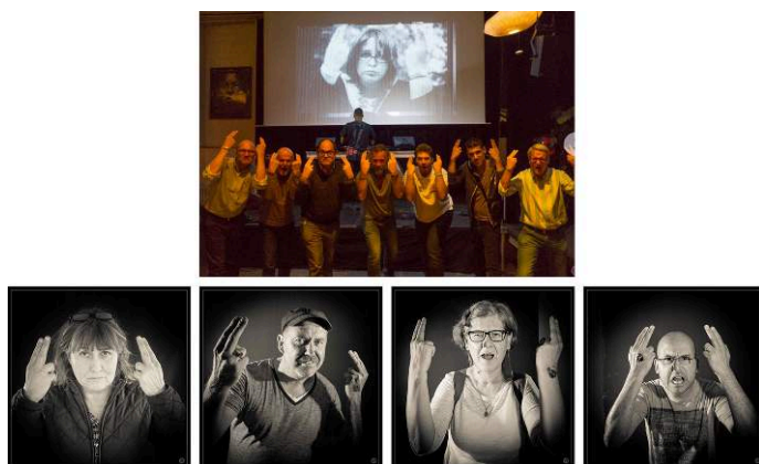
Figure 7 – Les « indignés » sourds

La mobilisation des « Indignés » (évoquée au début de cet article) offre un exemple complet de circulation entre les langues, cultures et supports qui peuvent être mobilisés dans les performances variées autour des slogans : le terme français Indignés a été traduit en LSF par ce signe [REDRESSE-SES-OREILLES], il a fait l'objet tour à tour de slogans écrits, d'un chansigne et d'une série de portraits photographiques (Fig. 7).