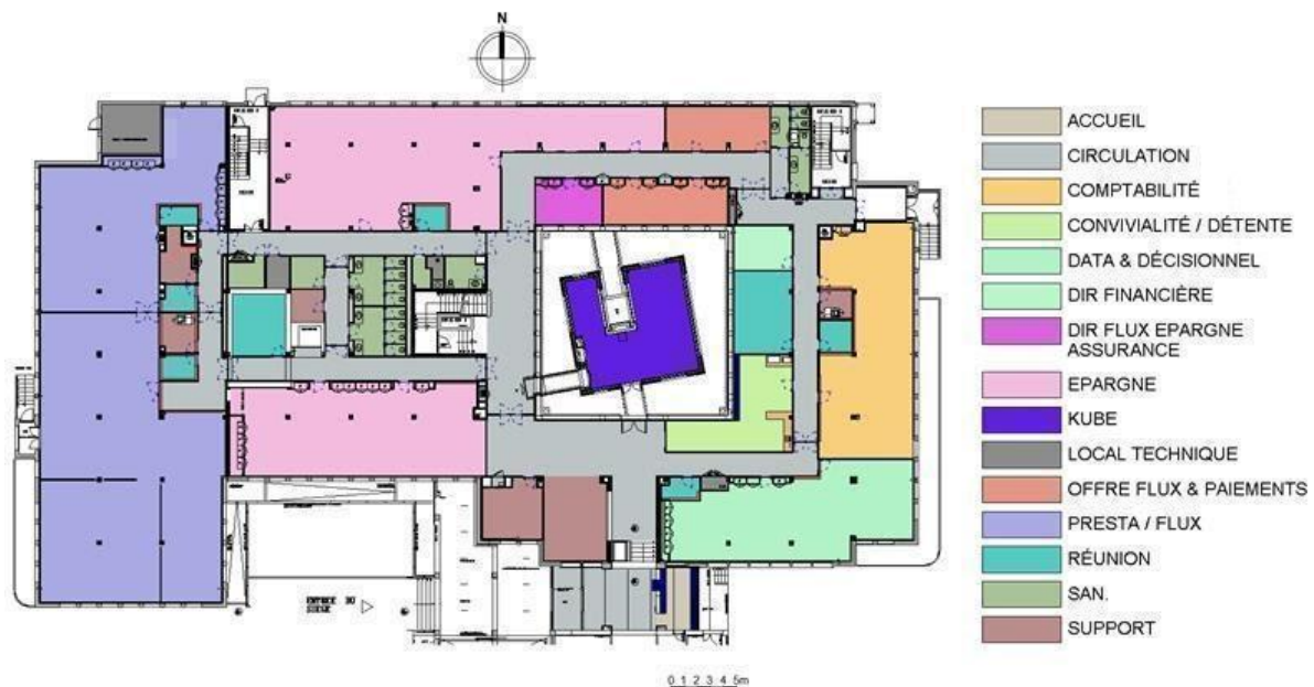
Schéma 1 : exemple d'un plan de « macrozoning »

Le « macrozoning » consiste à attribuer les zones d'un étage ou d'un bâtiment aux différentes équipes d'une entreprise en tenant compte de leurs effectifs et de la superficie du bâtiment. Sur les plans, un code couleur est mis en place pour permettre d'identifier l'espace de travail attribué à chaque équipe. On voit par exemple, ci-dessus, que deux espaces sont dédiés au