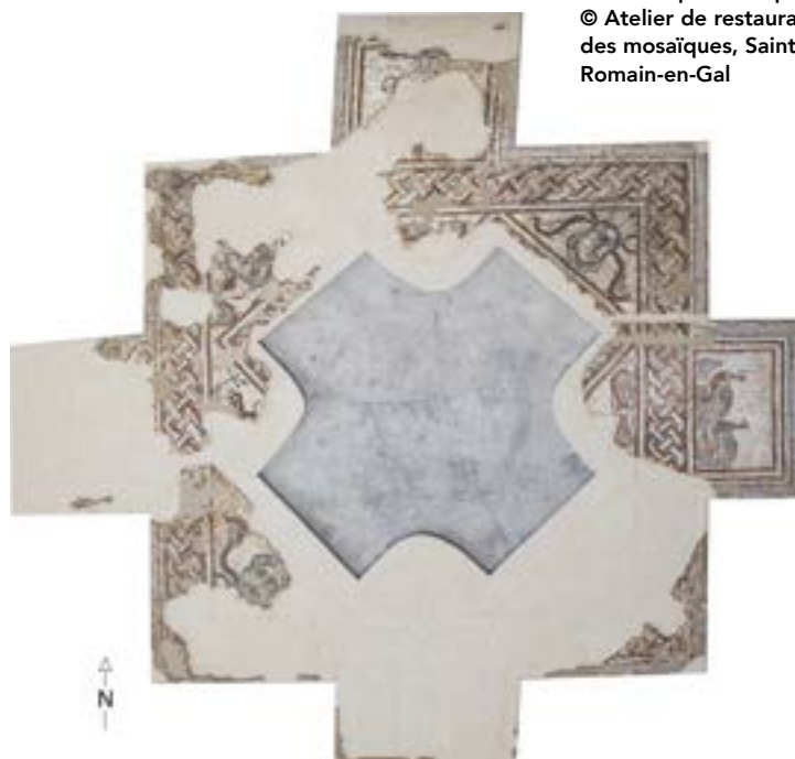
La mosaïque du baptistère.

Mariana est une colonie romaine installée sur le littoral nord-oriental de la Corse. Elle a joué un rôle administratif et économique important à l'échelle de l'île, qui lui a permis d'être élevée au rang de siège épiscopal. Durant les premières années du V e siècle, un complexe chrétien est érigé sur une domus bordant le decumanus le plus méridional de la ville. Cet ensemble est constitué d'une basilique à trois nefs, dont le chœur a été doté d'un tapis de mosaïque couvrant le podium et ses abords immédiats au nord et au sud, et d'un baptistère indépendant, au sol entièrement mosaïqué.