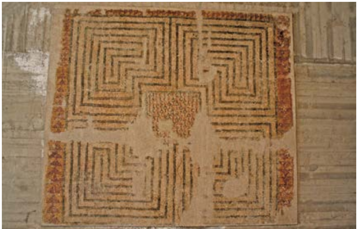
Mosaïque du labyrinthe de Chlef.

Au-delà de ce pavement, dans le collatéral nord, le regard embrasse tour à tour une composition en sparterie lâche en paire de tores avec cercles inscrits en entrelacs en intervalle et un médaillon portant l'inscription semper pax (la paix toujours). Celle-ci est une invitation à ne pas céder à la violence dans les conflits entre catholiques et donatistes menaçant la paix sociale.