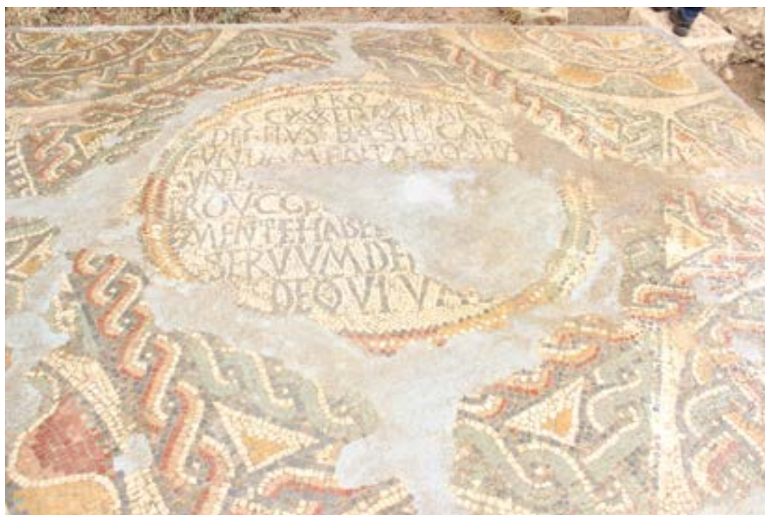
Mosaïque de la dédicace de la basilique de Chlef.