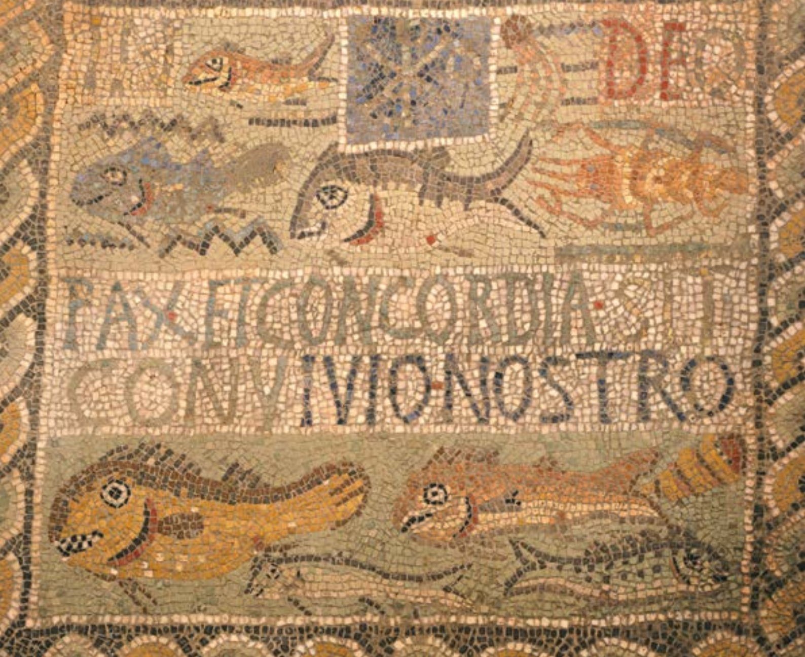
Mosaïque provenant de la basilique chrétienne de la colline ouest de Tipasa (Algérie). Tipasa, musée archéologique.