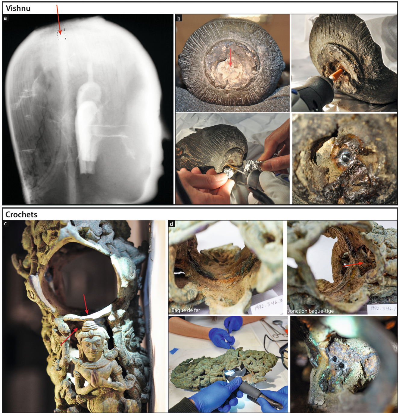
Fig. 3 a-d. Localisation de l'armature et repérage des zones favorables aux prélèvements pour la statue de Vishnu (a-b) et les crochets de palanquin (c-d). a. © C2RMF/T. Borel ; b-d © S. Leroy/M. Fenn.