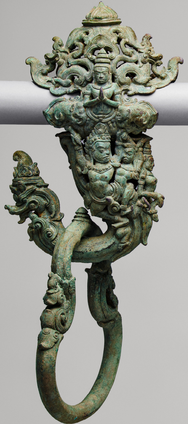
Fig. 2. Accrochage complet de palanquin comprenant deux crochets : inv. 1992.346.1 (H. 33,5 cm, l. 20,3 cm, D. 7,6 cm) et inv. 1992.346.3 (H. 34,2 cm, l. 19,4 cm, D. 9,5 cm), deux anneaux de suspension (inv. 1992.346.2 et 1992.346.4) et une douille centrale (inv. 1992.346.5), Asian Art Museum of San Francisco, Museum purchase, The Avery Brundage Collection.