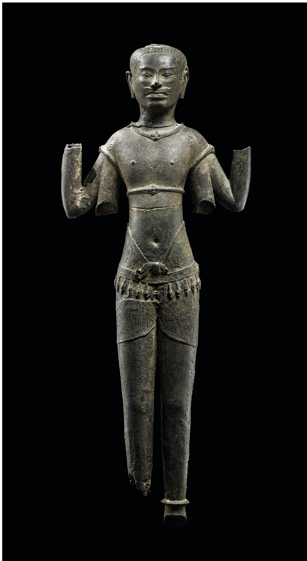
Fig. 1. Statue de Vishnu (inv. MA1339) (H. 87 cm, L. 34,5 cm, P. 12 cm), Paris, Musée national des arts asiatiques – Guimet.