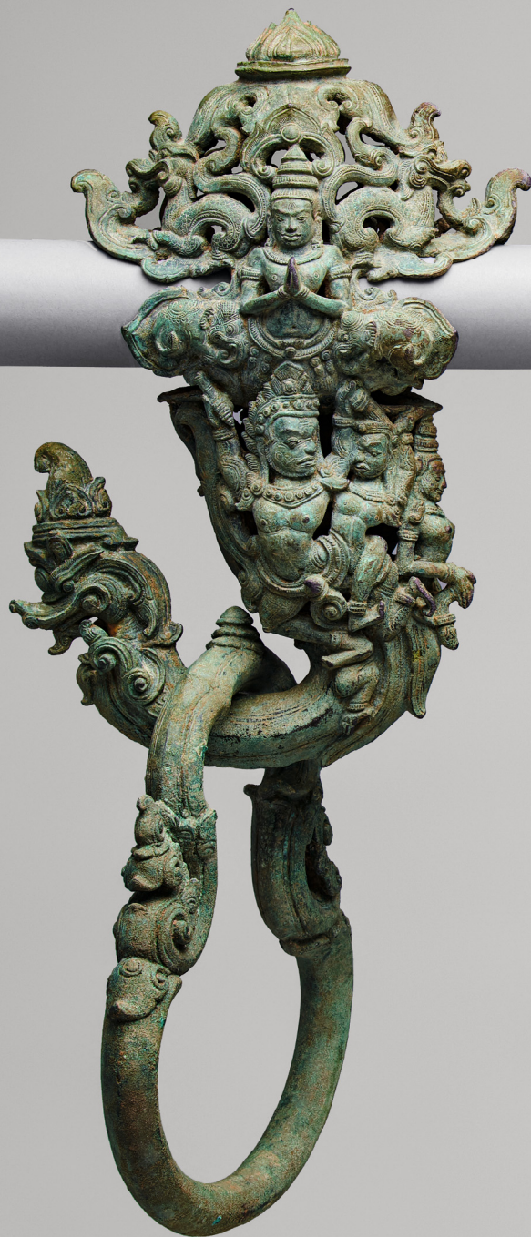
Fig. 2. Accrochage complet de palanquin comprenant deux crochets : inv. 1992.346.1 (H. 33,5 cm, l. 20,3 cm, D. 7,6 cm) et inv. 1992.346.3 (H. 34,2 cm, l. 19,4 cm, D. 9,5 cm), deux anneaux de suspension (inv. 1992.346.2 et 1992.346.4) et une douille centrale (inv. 1992.346.5), Asian Art Museum of San Francisco, Museum purchase, The Avery Brundage Collection.