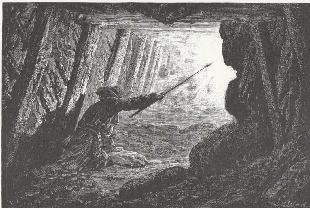
Fig. 68. — Le pénitent enflammant le grisou.

apparaît comme un mage qui de sa baguette produit une lumière très intense, fireman , l'homme du feu.