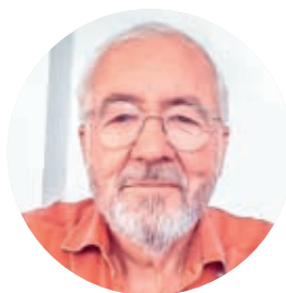
Éric Debarbieux, Professeur émérite en sciences de l'éducation à l'université Paris-Est Créteil

N.B. Ce rapport est une étape pour un travail plus complet, qui sera publié à la rentrée 2023-2024. Il est au maximum allégé des références scientifiques, même si derrière chaque tableau elles pourraient être nombreuses. Il est en effet destiné à éclairer le débat public, et nous avons souhaité qu'il soit le plus simple et le plus bref possible. De la même manière, nous avons souhaité limiter au maximum nos propres interprétations, sauf pour éviter quelques récupérations malséantes sur des sujets aussi sensibles.