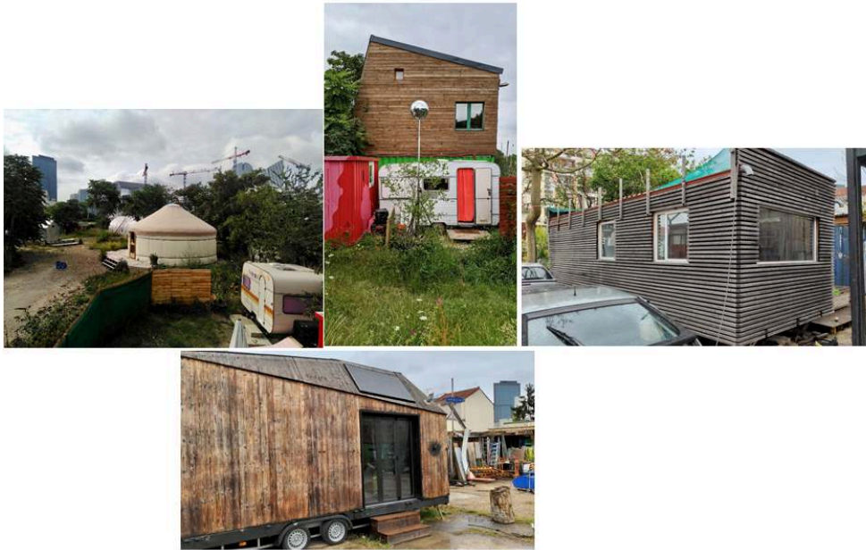
Figure 4. Planche photographique des modes d'habitat léger sur la friche de Vive les Groues : yourte, caravane, mobil-home et tiny house , 2021-2022