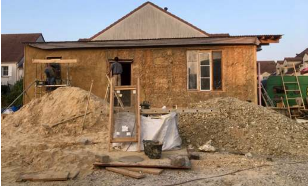
Figure 3. Photo prise par l'auteure lors du chantier participatif du bâtiment terre-paille au jardin de la Récolte urbaine à Montreuil (93) en 2018

Extrait d'entretien avec un bénévole du jardin de la Récolte urbaine, 2018.