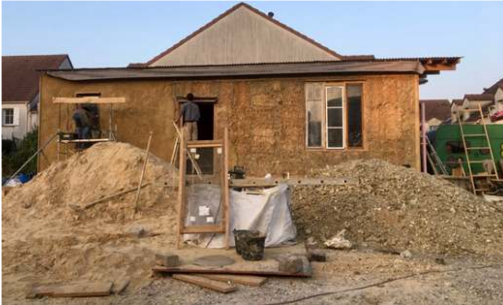
Figure 3. Photo prise par l'auteure lors du chantier participatif du bâtiment terre-paille au jardin de la Récolte urbaine à Montreuil (93) en 2018

Extrait d'entretien avec un bénévole du jardin de la Récolte urbaine, 2018.