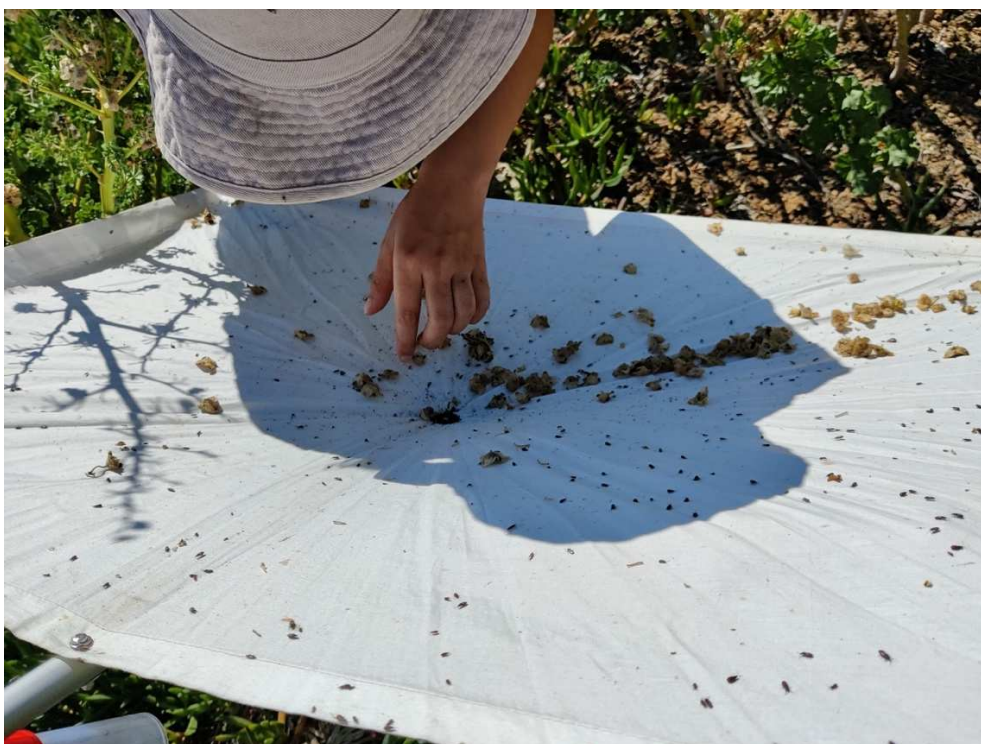
Fig. 23 – Pullulation de Oxycarenus lavaterae (Fabricius, 1787) sur le Lion de mer

Sur les 14 spécimens d'araignées collectés, seul Heser nilicola (O. Pickard-Cambridge, 1874) avait atteint le stade adulte, les individus juvéniles appartenant aux familles des Agelinidae, Araneidae, Linyphiidae, Salticidae et Thomisidae (genres Puchellodromus et Xysticus ). Concernant les autres arachnides, une espèce de scorpion Euscorpiones tergestinus (C. L. Koch, 1837) et une espèce de pseudoscorpion, Hysterochelifer tuberculatus (Lucas, 1849) ont été identifiées, cette dernière restant à confirmer par un spécialiste taxonomiste. De même pour Porcellio lamellatus Budde-Lund, 1885, localisée sur le Lion de mer. Il est également à noter sur cet îlot la présence de blattes, de dermaptères et de collemboles (Symphypléone et Poduromorphe).