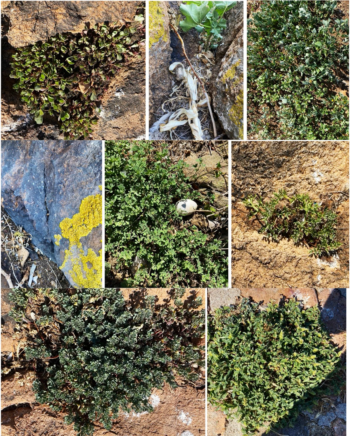
Fig. 8-15 - Autres espèces végétales observées sur le Lion de Mer