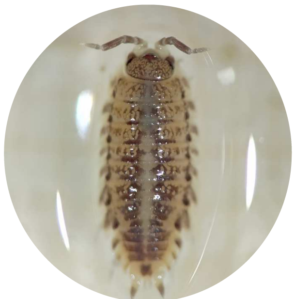
Fig. 26 – Identification de Hysterochelifer tuberculatus (Lucas, 1849) et Porcellio lamellatus Budde-Lund, 1885 à confirmer par les experts taxonomistes.