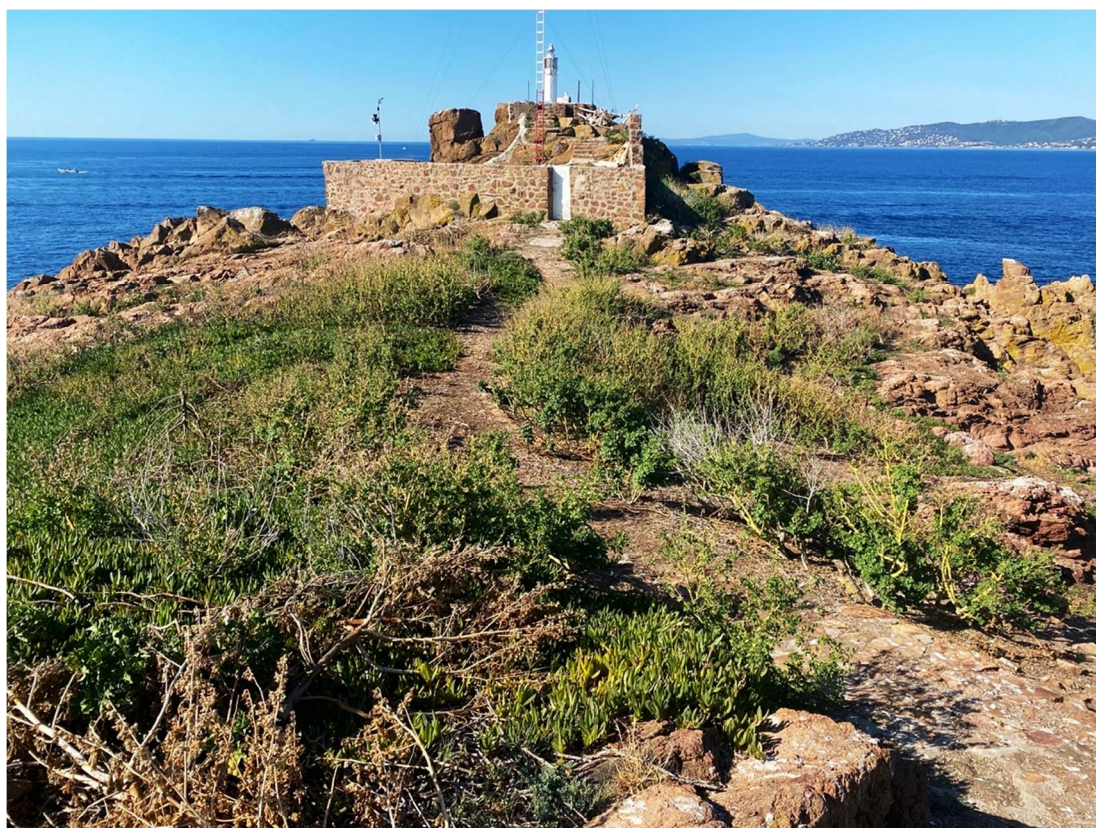
Fig. 2 - Lion de Mer.