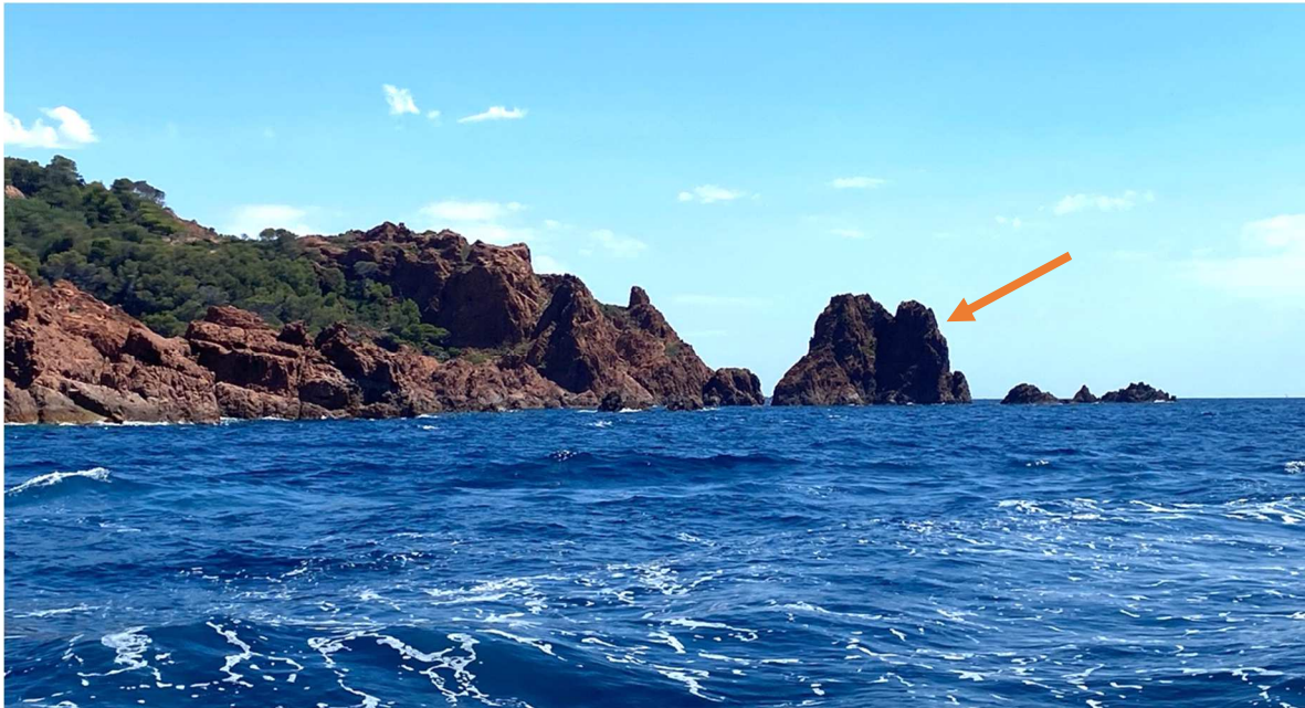
Fig. 17 - Îlot de la Pointe du Dramont.

Aucun reptile, ni trace de présence, n'a été observé.