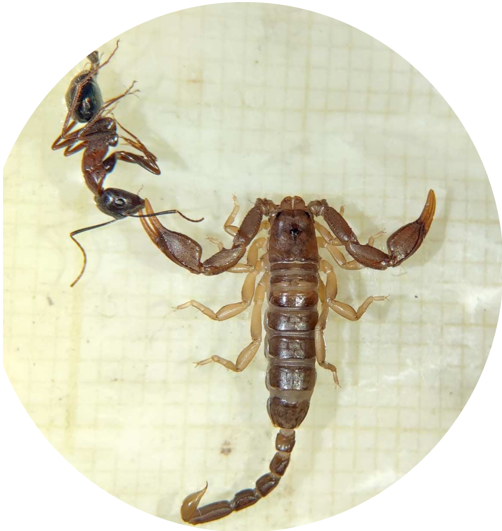
Fig. 25 – Euscorpiones tergestinus (C. L. Koch, 1837) capturé capturant des Camponotus sylvaticus (Olivier, 1792)