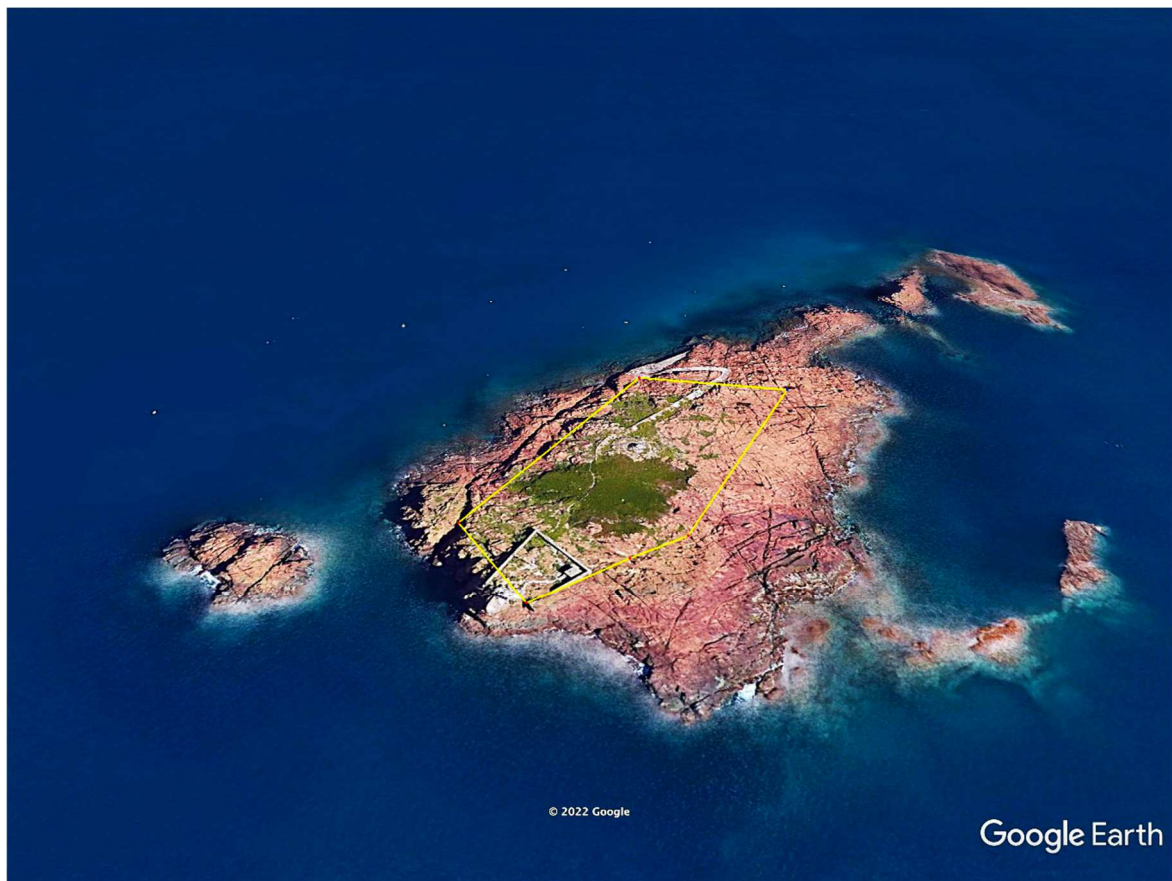
Fig. 6 - Transect linéaire (itinéraire en sens antihoraire) de Podarcis muralis (chemin le long de la ligne jaune)