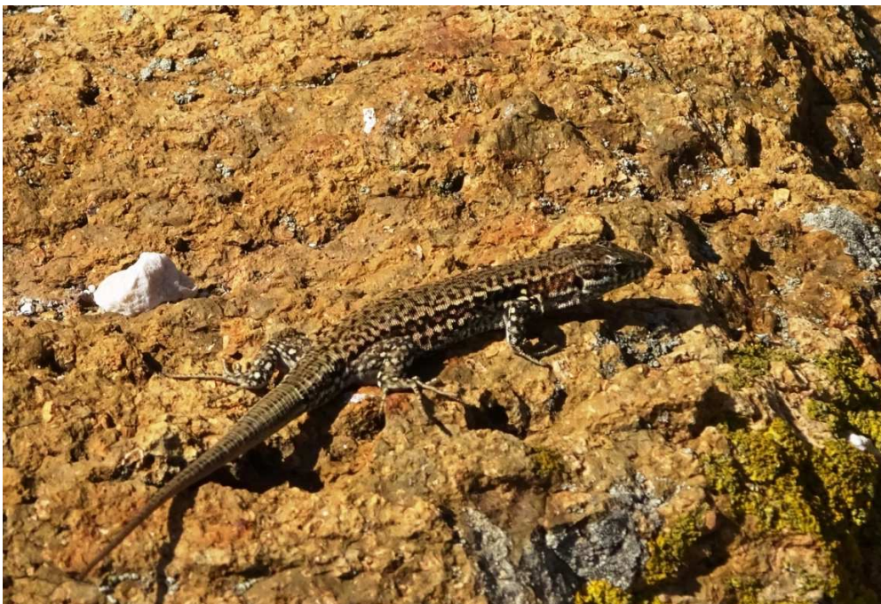
Fig. 4 - Podarcis muralis , ♂ Lion de Mer

La présence d'un lézard appartenant à l'espèce Podarcis muralis a été détectée sur l'île. Les lézards ont ensuite été comptés le long d'un transect linéaire (Fig. 4, le chemin suivi est celui correspondant aux lignes jaunes) afin d'avoir une idée de la taille de cette population. Le long du transect, parcouru de 8h40 à 9h15, 14 individus ont été aperçus. Sur le plan morphologique (dessin, coloration), ils ne présentent pas de particularismes par rapport aux populations continentales adjacentes.