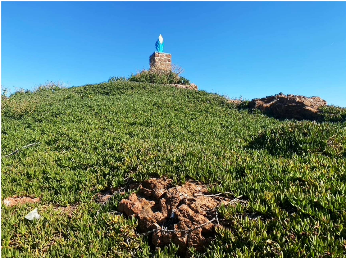
Fig. 7 - Tapis de Carpobrotus sur le côté sud de l'île.