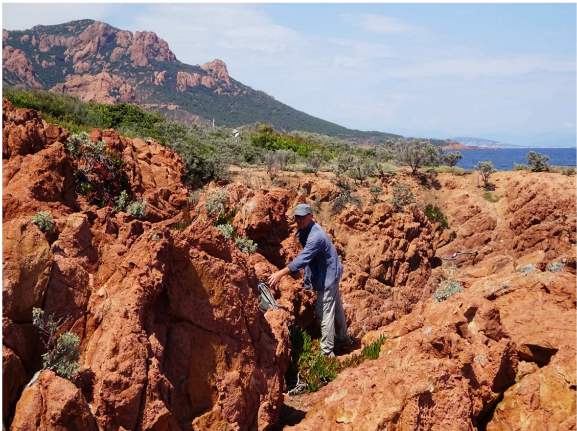
Fig. 22 - Recherche d'indices de présence d' Euleptes europaea sur l'îlot des Vieilles