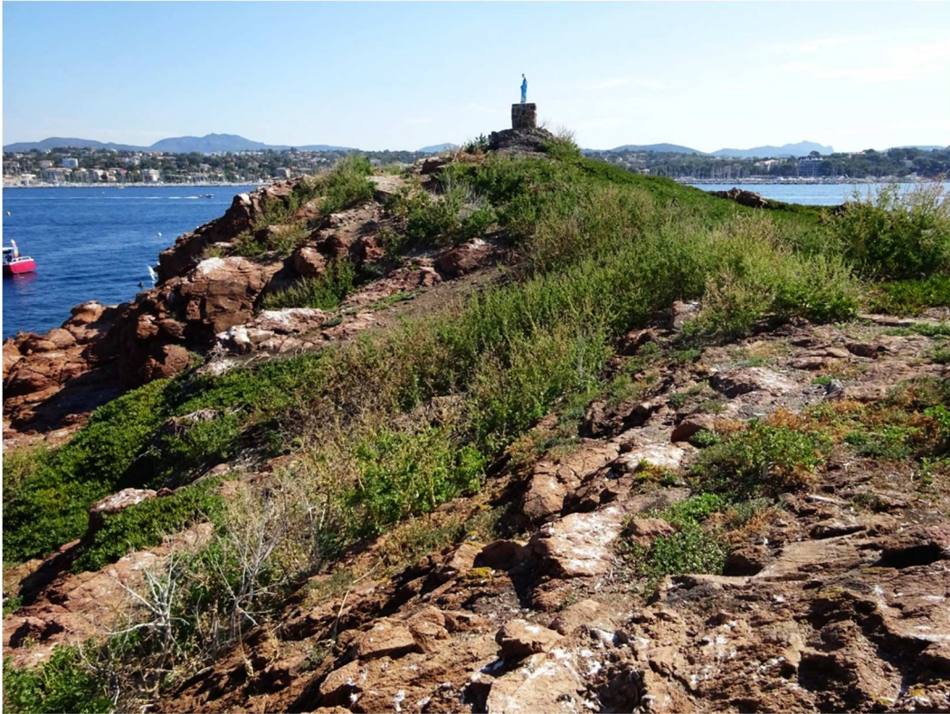
Figure 3 – Lion de Mer

La présence d'un lézard appartenant à l'espèce Podarcis muralis a été détectée sur l'île. Les lézards ont ensuite été comptés le long d'un transect linéaire (Fig. 4, le chemin suivi est celui correspondant aux lignes jaunes) afin d'avoir une idée de la taille de cette population. Le long du transect, parcouru de 8h40 à 9h15, 14 individus ont été aperçus. Sur le plan morphologique (dessin, coloration), ils ne présentent pas de particularismes par rapport aux populations continentales adjacentes.