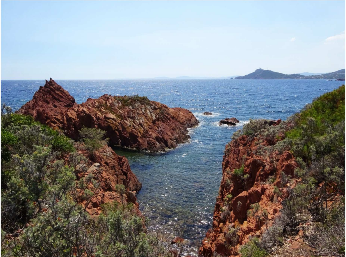
Fig. 21 - Vue de la côte sud-ouest de l'îlot des Vieilles