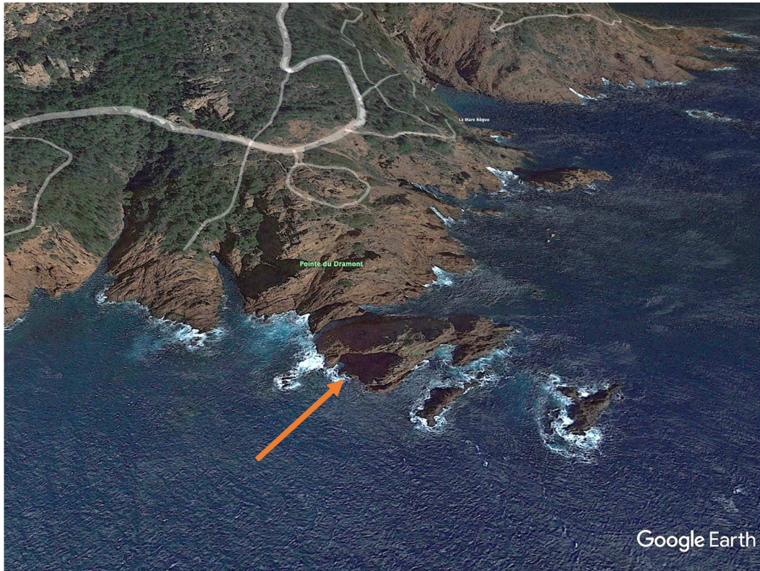
Fig. 16 - Îlot de la Pointe du Dramont par Google Earth.

L'îlot a un relief accentué : altitude environ 24m, surface 1200 m 2 environ et largeur de la passe 1,50m. Il est entièrement formé de rhyolithe et présente une certaine hétérogénéité, présence de sol, micro-vallons pentus sur les faces sud et Est, petites plates-forme.