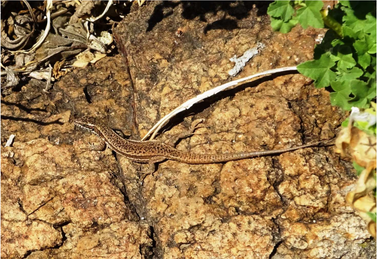
Fig. 5 - Podarcis muralis , ♀Lion de Mer