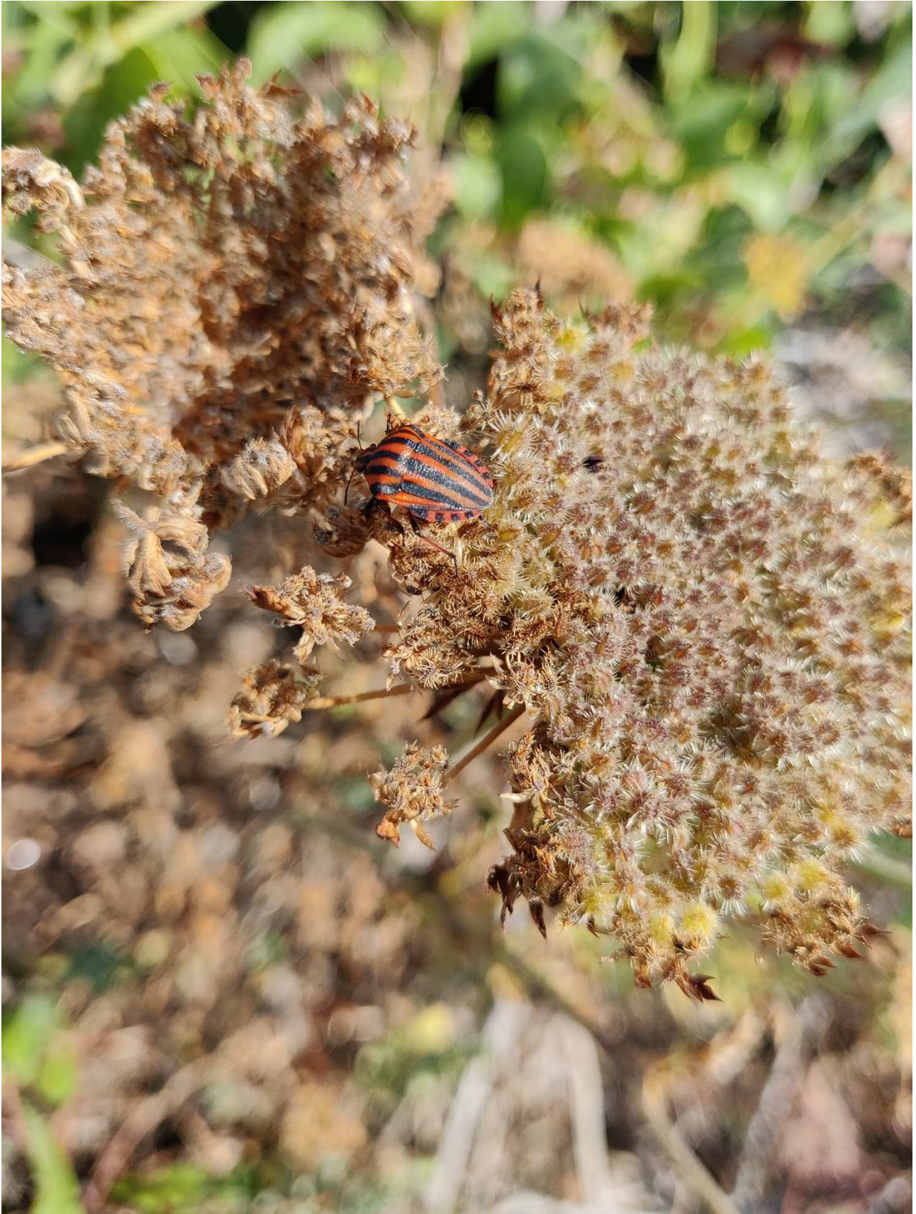
Fig. 24 – La Punaise arlequin Graphosoma italicum (O.F. Müller, 1766) sur une ombellifère de l'île des Vieilles