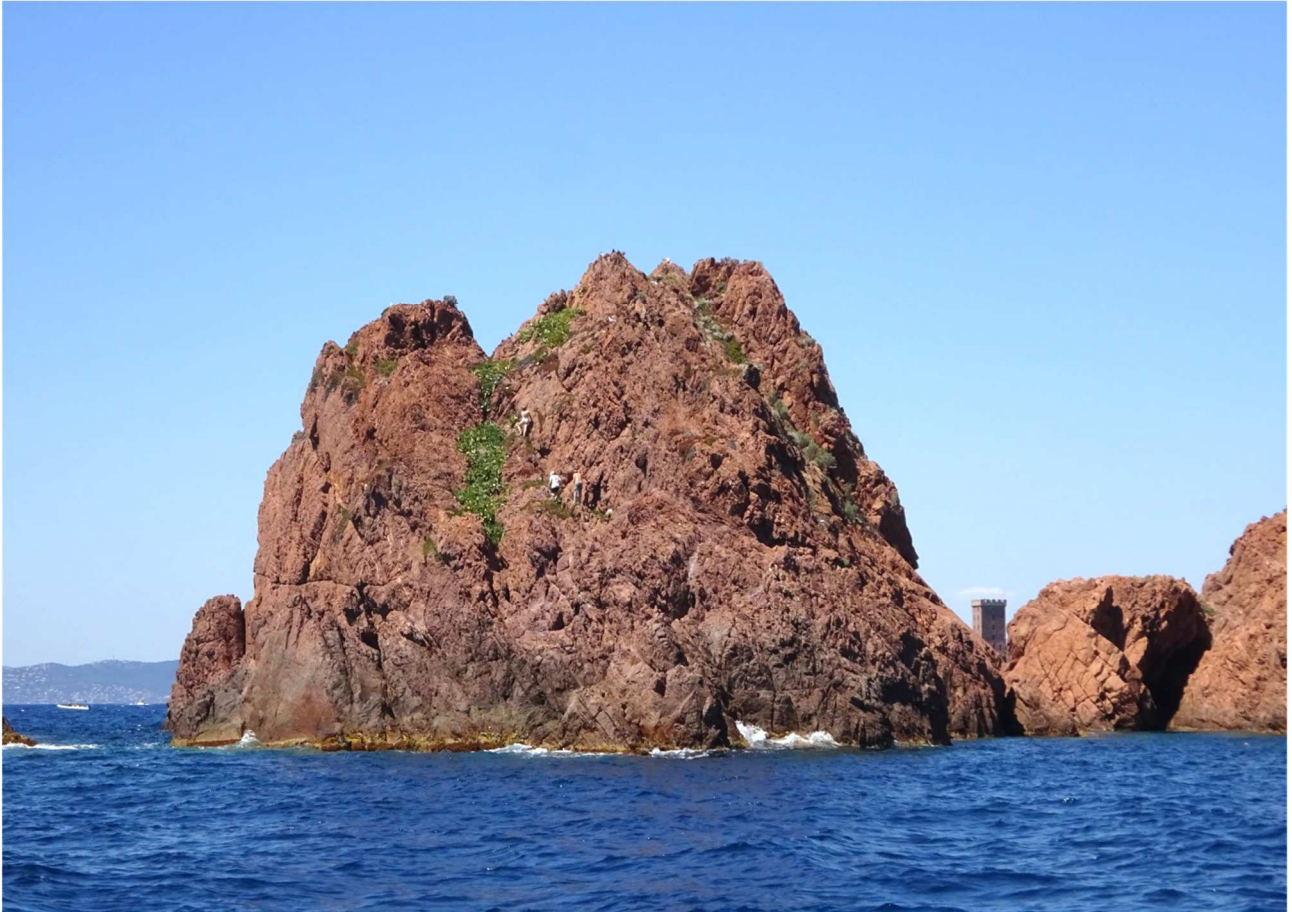
Fig. 19- ascension de l'Îlot de la Pointe du Dramont. En arrière plan, la tour de l'île d'Or