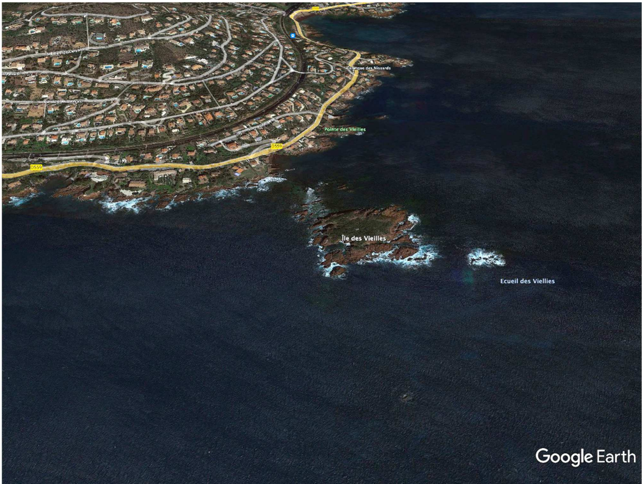
Fig. 20 - Île des Vieilles par Google Earth.

Sur cet îlot se caractérise par une végétation herbacée, arbustive et arborée variée et, dans certains secteurs très dense (fourrés à Quercus ilex et Pinus halepensis ). Du fait de l'extrême chaleur, seuls quelques lézards en fuite ont été vus, ainsi que des des fèces en quelques endroits. Il s'agit très probablement de Podarcis muralis . Il n'est pas possible pour le moment de juger de l'état de la population de cette espèce, compte tenu de la période d'observation défavorable à laquelle nous avons visité l'île, c'est-à-dire au moment le plus chaud de la journée, mais la population semble petite; il serait donc important de pouvoir visiter l'île à une saison plus favorable.