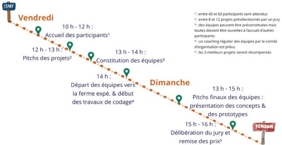
Figure 4 : Déroulement du concours sur les 48 h (Source : Acta).

L'évènement en lui-même s'est déroulé sur un temps limité à 48 heures, depuis les présentations ( pitches ) des idées de projet par les porteurs au jury.