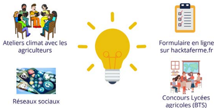
Figure 2 : Le processus d'idéation repose sur quatre modalités complémentaires (Source : Acta).

Mais l'essentiel de la plus-value pour les projets de cette phase de préparation est à deux niveaux : la phase d'idéation, et le recrutement des profils diversifiés et de qualité.