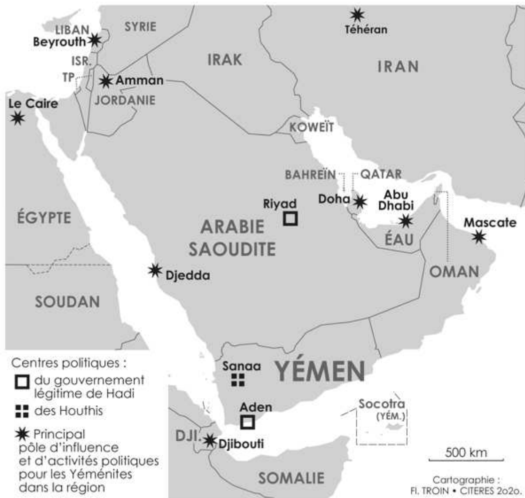
Carte 2. Géographie politique régionale du Yémen en guerre (2015-2020)