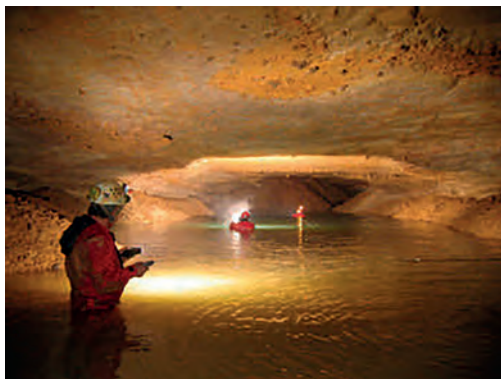
Figure 3 : Haut niveau de nappe dans la grotte de La Fuie (photo : D. Doucet, 23 mars 2007)

Si l'on replace ces deux types de spéléogénèse dans l'histoire géologique du Bassin aquitain, on identifie deux périodes. D'abord, entre la fin du Kimméridgien (152 Ma) et le début du Cénomaniens (100 Ma), la plate-forme était faiblement émergée et le gradient hydraulique quasi inexistant. Ensuite, après l'émersion fini-crétacée, la plate-forme a évolué sous la formation d'une épaisse couverture détritique continentale.