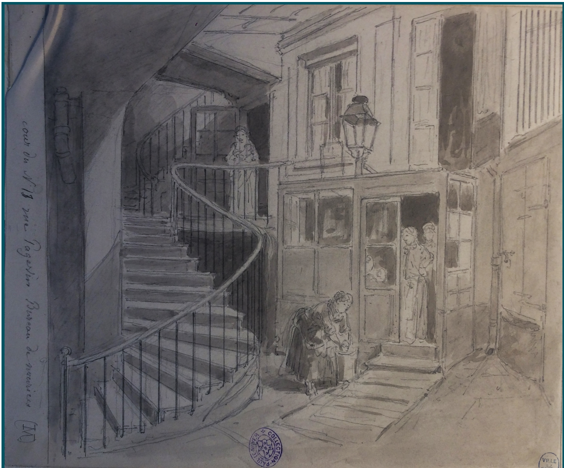
Cour du n°13, rue Pagevin, bureau de nourrices

disparues : la « cour du n°13 rue Pagevin, bureau des nourrices (M) » évoque ainsi un pan de la vie quotidienne de ce quartier, au même titre que les locaux des employés de la boutique de « voiture à bras, impasse de la Bouteille rue Montorgueil 31 » et des marchands de chiffon des maisons de la rue des Filles-Dieu.