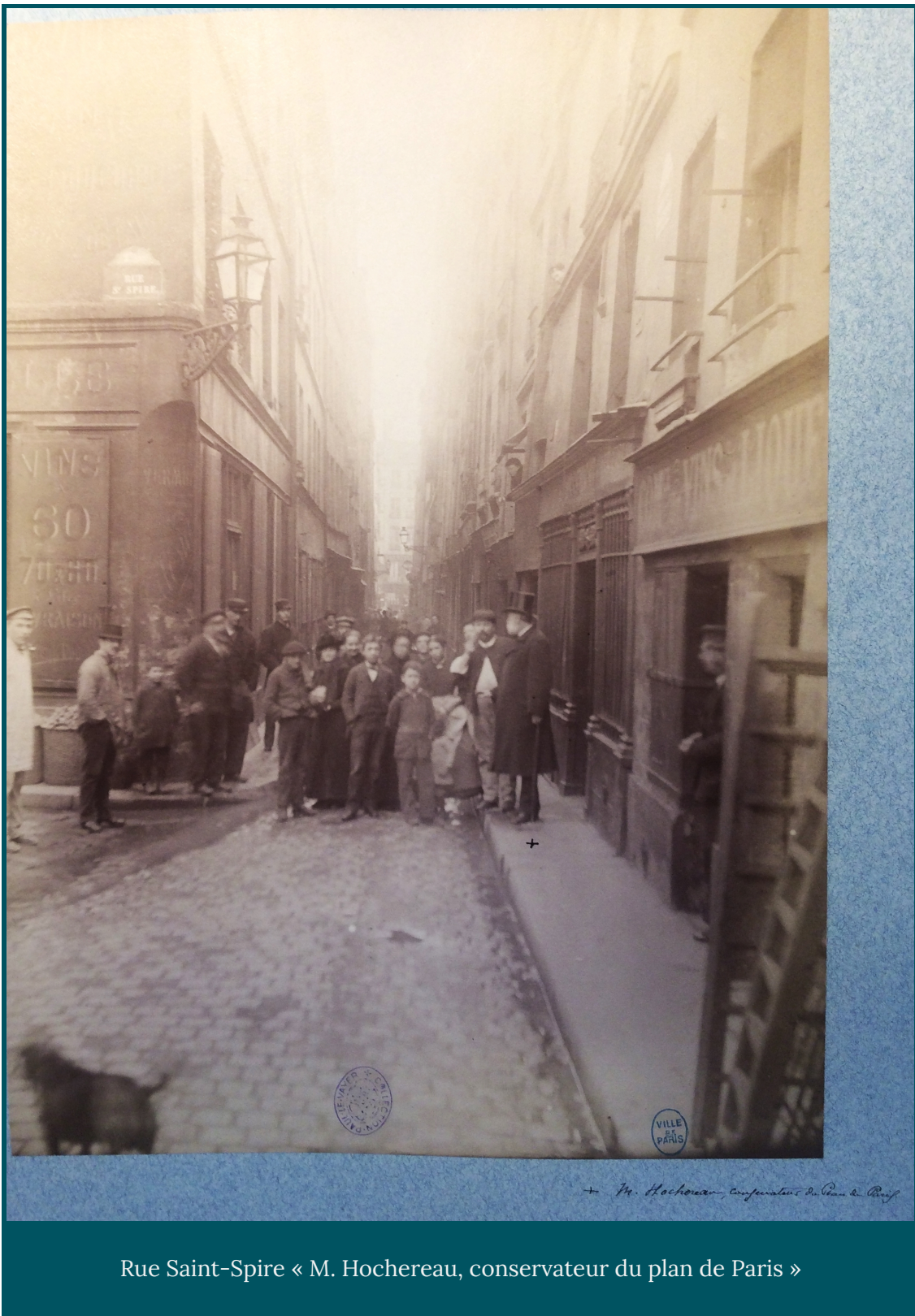
Rue Saint-Spire « M. Hochereau, conservateur du plan de Paris »

Le classement du fonds, par rue, met en valeur la multiplicité des supports employés pour garder la mémoire de ce vieux Paris en train de disparaître : aux photographies, répondent des plans, des élévations, des coupes, des croquis et des descriptions qui donnent une épaisseur documentaire remarquable aux ilôts relevés. Les croquis portent chacun une lettre, telle que « cour du n°9 rue Pagevin, vue prise côté nord (L) », lettre reportée sur le plan et accompagnée d'une flèche indiquant le sens de prise de vue. En observant ces liasses, nous pénétrons dans l'intimité de maisons aujourd'hui