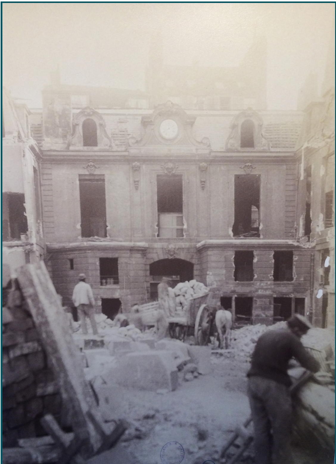
La démolition de l'hôtel de Vic