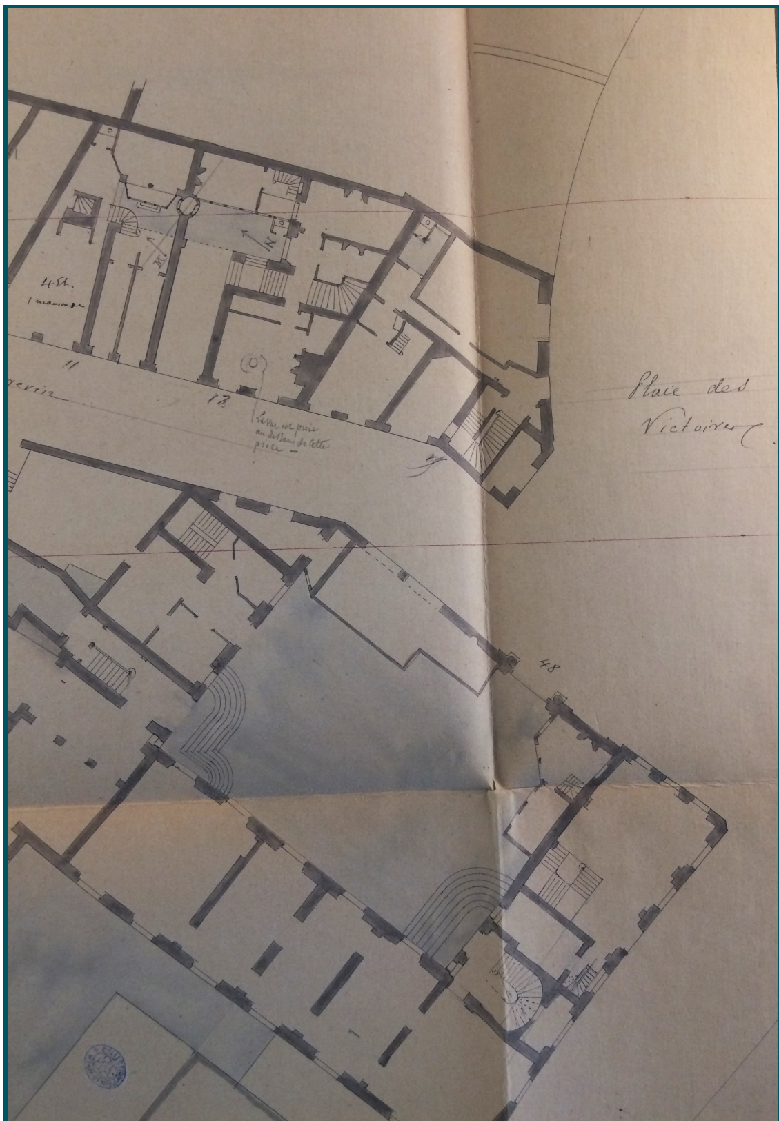
Détail du plan d'ensemble des maisons rue Pagevin et place des Victoires

À la différence des maisons de la deuxième section, celles situées dans la première, aux abords de la place des Victoires, bénéficient de description détaillées, exception faite de l'hôtel de Pomponne. L'auteur y évoque les matériaux employés (pierre de taille « pour la partie correspondant au rez-de-chaussée », rampe « en fer forgé style Louis XIII ») ainsi que l'état sanitaire du bâti. Si l'une des causes du réaménagement de