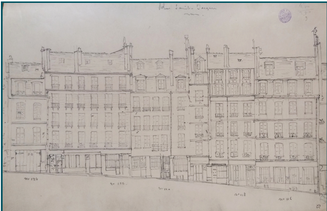
Élévation des maisons n°116 à 124, rue Saint-Jacques

Émile Hochereau, qui rassemble les documents, pourrait également avoir collaboré à la réalisation de ces relevés. Il apparaît notamment sur l'une des photographies prises depuis la rue Saint-Spire. Il en est de même de Paul Le Vayer, donateur du fonds, qui participe à l'écriture du texte sur l'histoire de la maison de Marat.