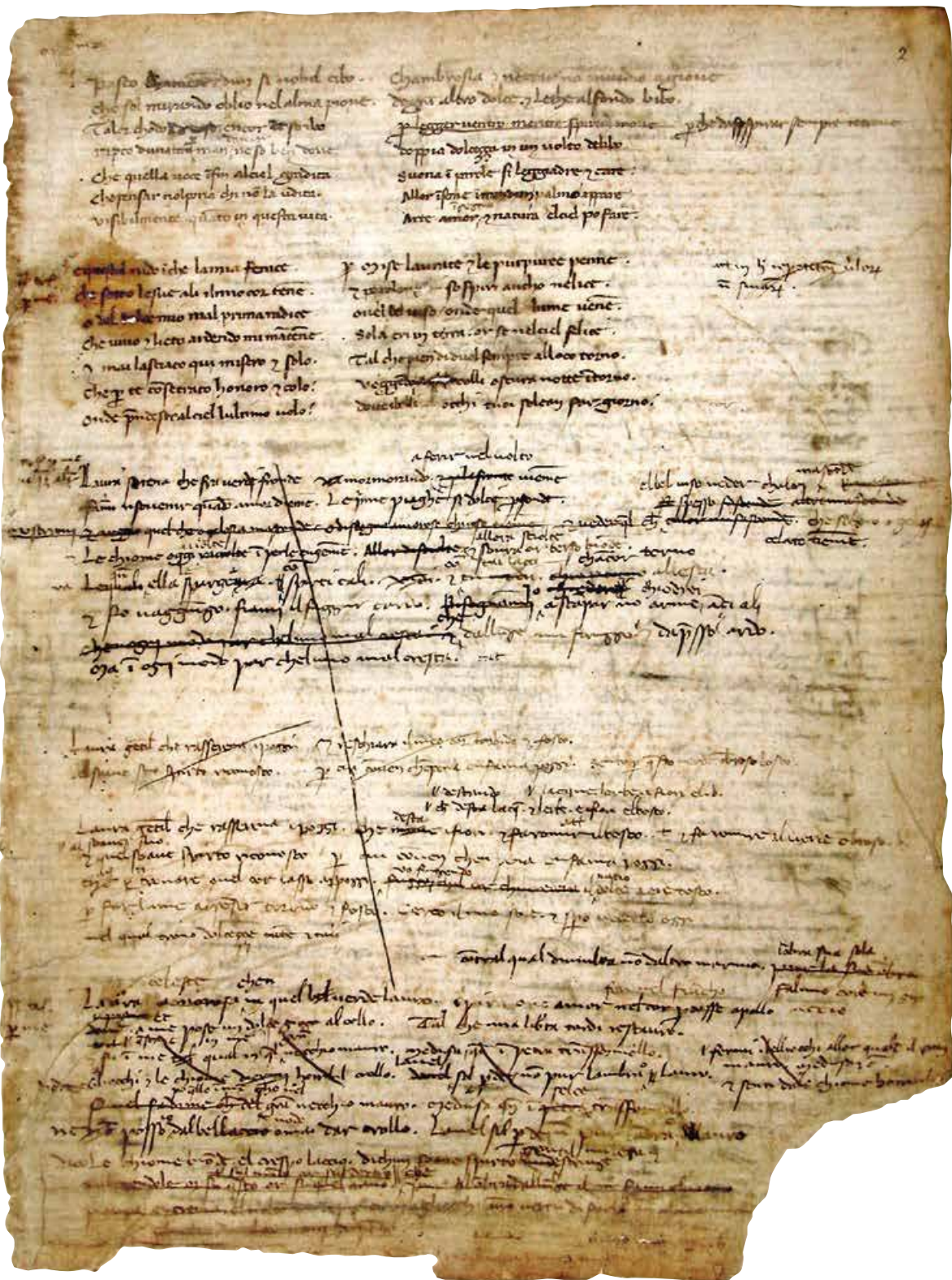
Fig. 3 : Pétrarque, Codice degli abbozzi , Vat. lat. 3196, f. 2 r°.