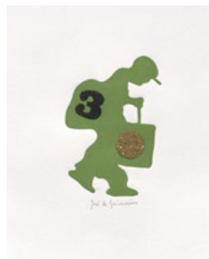
José de Guimarães, Vozes Nômadas e Migrantes XLVI , 2018, Prova única, tinta de impressão aquosa e vidro moído, 33x25,7 cm, BNP E.2541V.