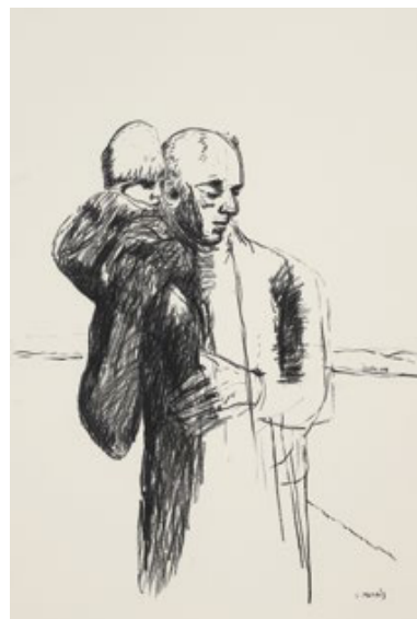
Graça Morais, Migrante III , 2018, Carvão sobre papel, 152,4 x 102,5 cm, Ateliê da Artista, fotografia de João Krull.