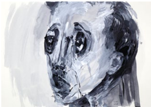
Graça Morais, Metamorfoses da Humanidade , series IX, 2018 Goma-laca sobre papel, 21 x 15 cm/cada, Coleção particular.