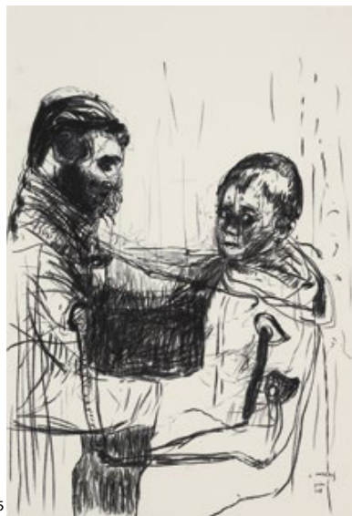
Graça Morais, Metamorfoses da Humanidade, series VII , 2018, Grafite sobre papel, 32 x 24 cm, 25,7 x 42 cm Ateliê da Artista, fotografia de João Krull.