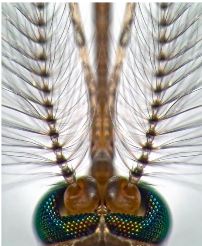
Fig. 1. Une tête de moustique mâle, vue de dessus. En bas en vert, les points brillants sont les lentilles des yeux composés entourant les deux organes de Johnston (« donuts ») à la base des deux antennes couvertes de fibrilles (« poils ») qui vibrent au passage.

chez le criquet) et comprenant un nombre de cellules sensorielles comparables à la cochlée humaine 10 .