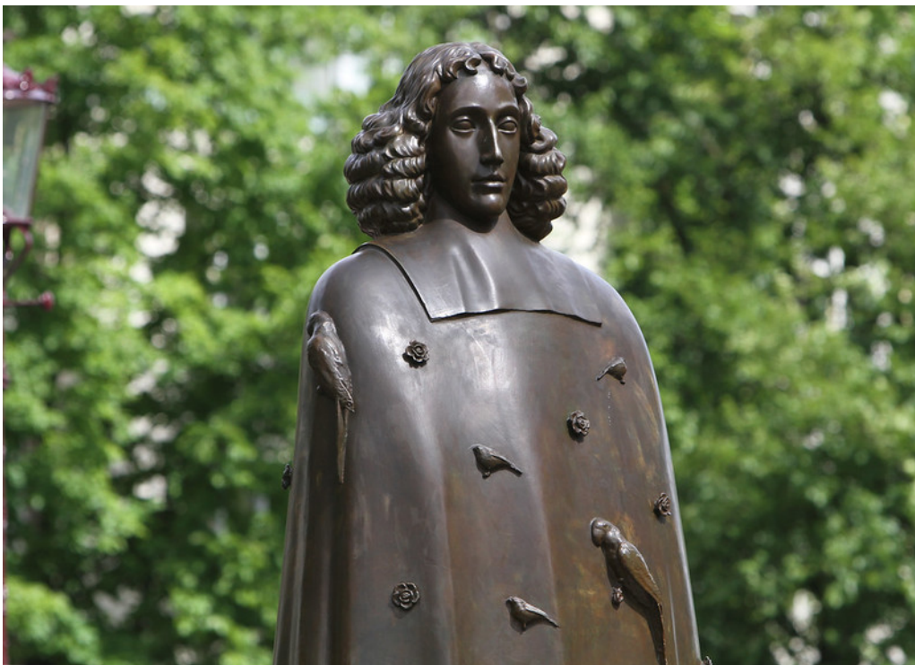
B. Spinoza