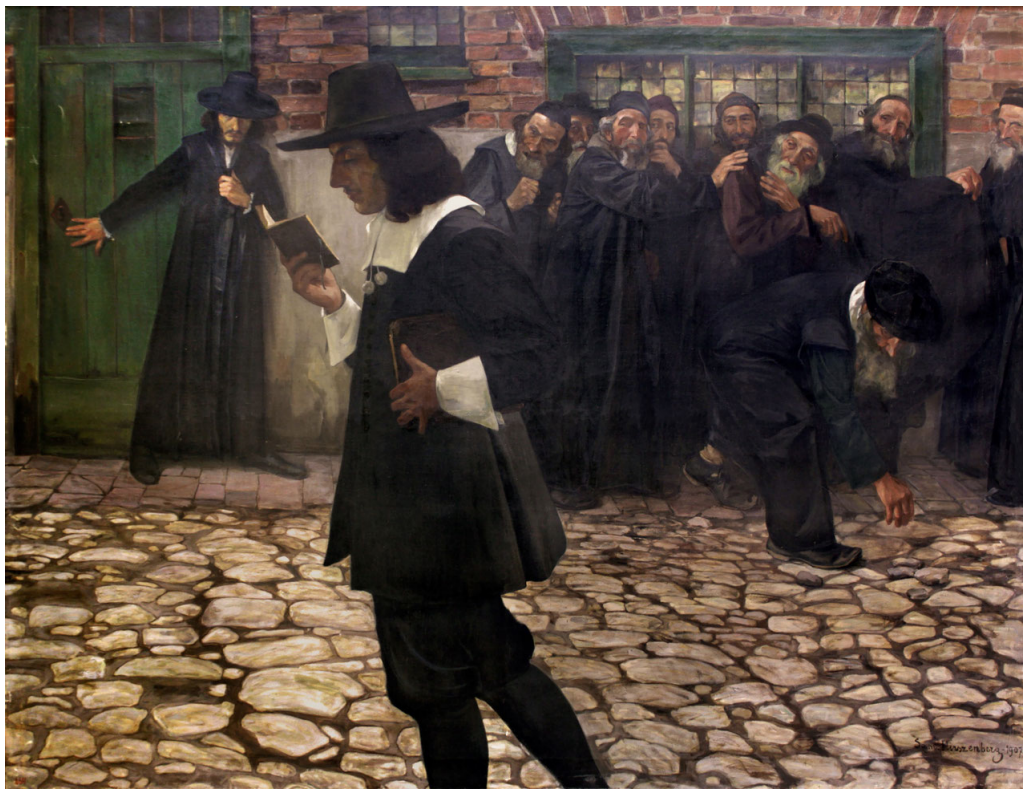
S. Hirszenberg, "Spinoza scomunicato", (1907)

Baruch Spinoza (1632-1677) ha applicato all'etica ed alla conoscenza di Dio il metodo matematico in voga nella sua epoca , offrendo al lettore una razionalità limpida e luminosa, intrisa di calma e di gioia. Una splendida avventura della mente e del cuore!