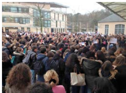
Les élèves du lycée d'Henri-Moissan de Meaux lors de la minute de silence, jeudi 8 janvier 2015 (photo publiée sur le site du journal de La Marne le jour même).

D'abord, je me dis que c'est pas forcément vrai, « On ne réalise pas », « Je ne comprenais pas ce que j'entendais [...] je n'arrivais pas y croire, cela me semblait irréaliste », « C'était un évènement qui faisait effraction dans le sentiment de sécurité personnel que j'avais. C'était extrêmement violent. Pour moi la France, c'est un pays dans lequel on est en sécurité et dans lequel ce genre de choses ne se produit pas. D'un seul coup ça venait chez nous », Je me sens en insécurité dans mon pays, je me dis « c'est grave ».