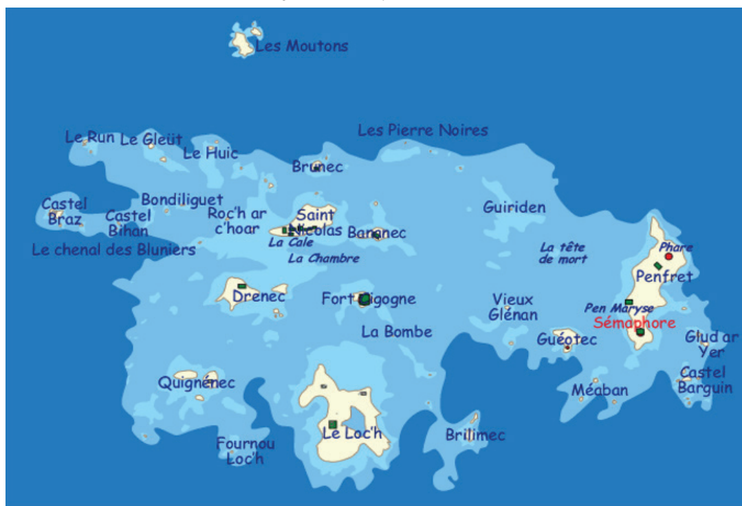
Figure 1 : L'archipel des Glénan