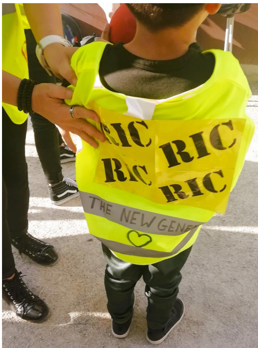
(Barbecue GJ, Rue de la loi) 20.06.2019

Ces GJ jusqu'au-boutistes insistent bien sur la portée de sortie de l'anonymat, de la solitude et de l'impuissance que recouvre le maintien de leur engagement au-delà des premières manifestations. Ici, on perçoit les effets d' empowerment individuels, rares mais réels, avant d'envisager à plus long terme des effets de socialisation et de transmission (Photo 8). Ainsi, il s'opère une reconnaissance symbolique qui est un support essentiel d'un engagement singulier.