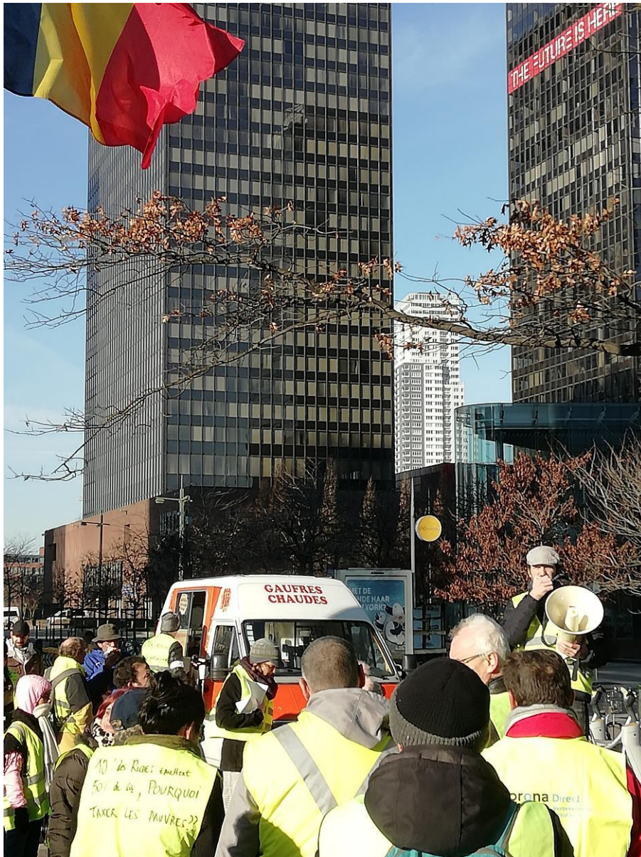
(Gare de Bruxelles-Nord) 19.01.2019

L'enquête de terrain 3 a principalement été menée entre novembre 2018 et décembre 2019 auprès des « Gilets Jaunes Bruxelles – Gele Hesjes Brussel » (1 500 membres), organisés via un groupe Facebook éponyme. Les données ont été générées via une pluralité de méthodes qualitatives. Des prises de contact lors des manifestations de la fin d'année 2018 à Bruxelles ont permis de recruter les participants à deux groupes de discussion en janvier 2019, avec chacun sept participants en français 4 , puis à un troisième en avril 2019 avec quatre participants