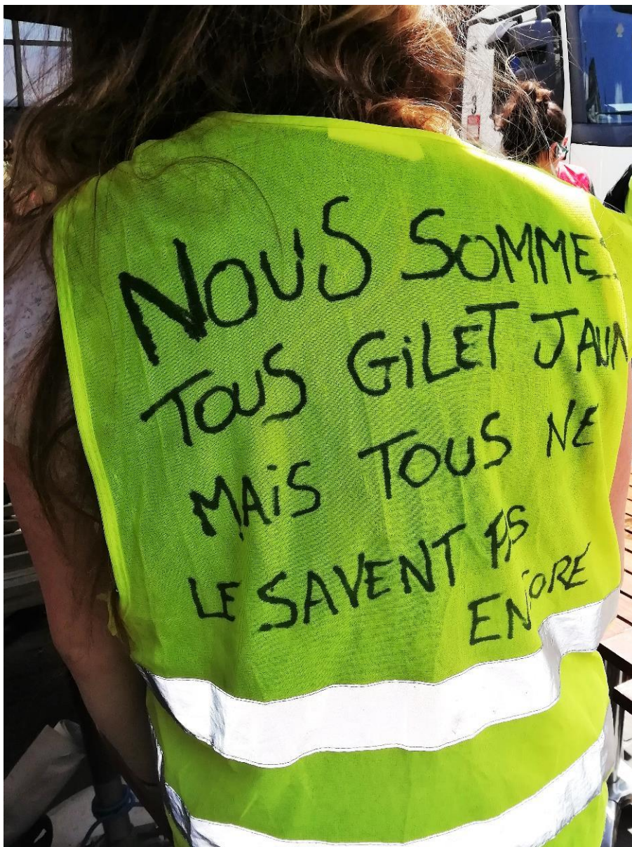
Photo 7 : « Nous sommes tous gilets jaunes mais tous ne le savent pas encore. »

(Terrasse de café, Boulevard de Waterloo) 09.07.2019