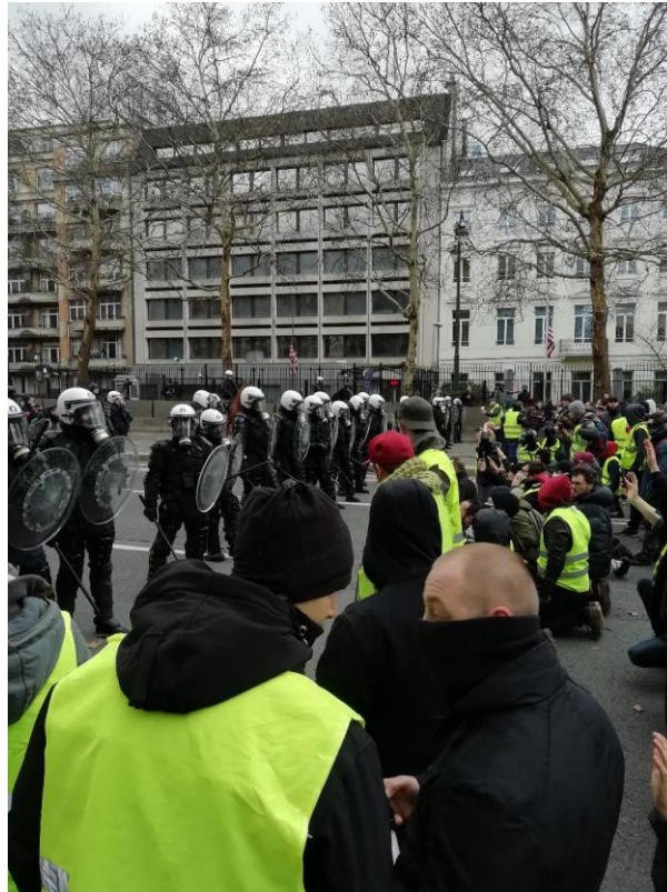
(Rue de la loi, Boulevard du Régent) 08.12.2018