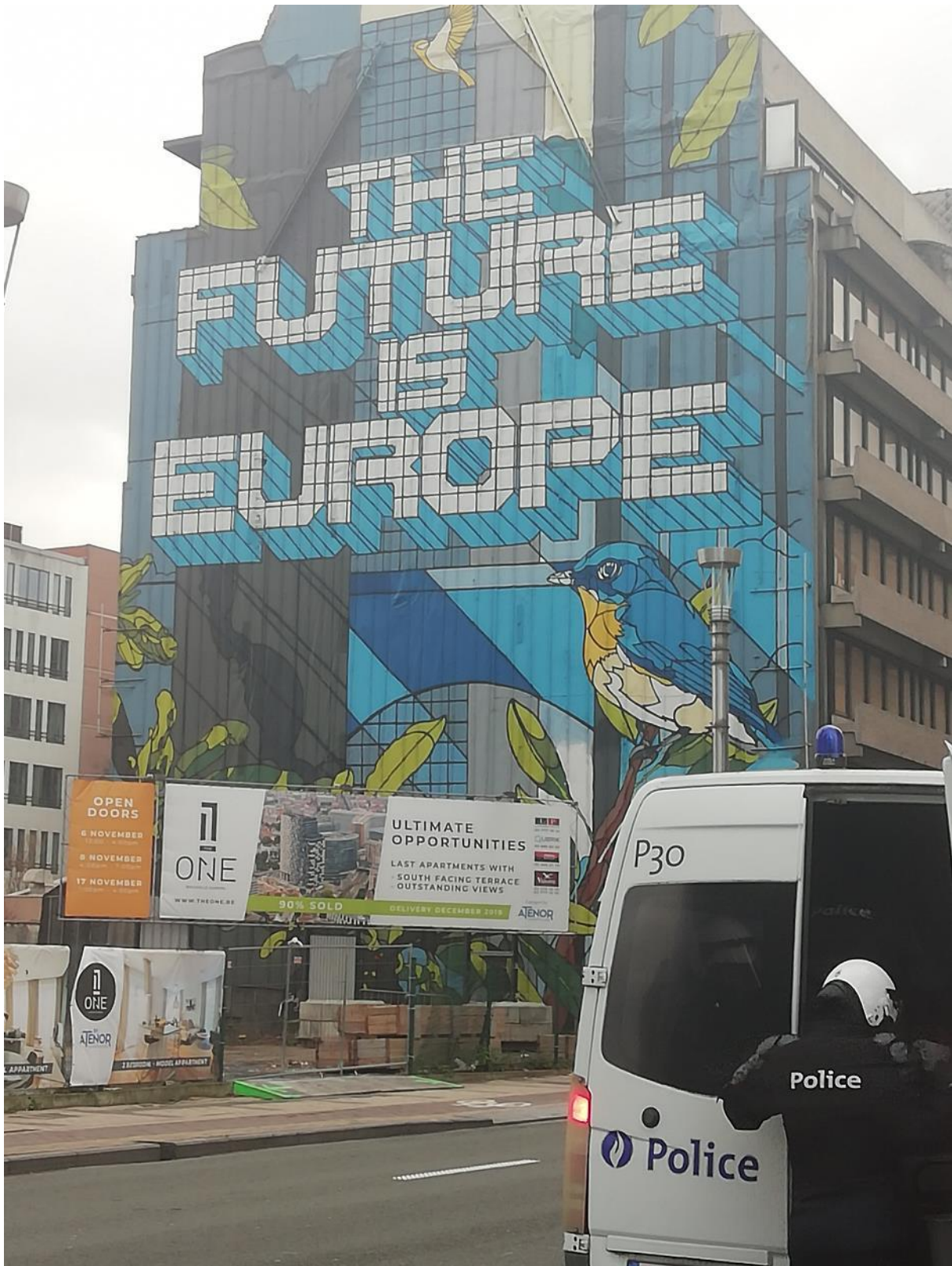
(Bruxelles-Schuman) 08.12.2018

D'ailleurs, selon leur propre histoire individuelle, les GJ de Belgique notent bien que leur proximité personnelle à la France est une explication claire de leur attention au mouvement.