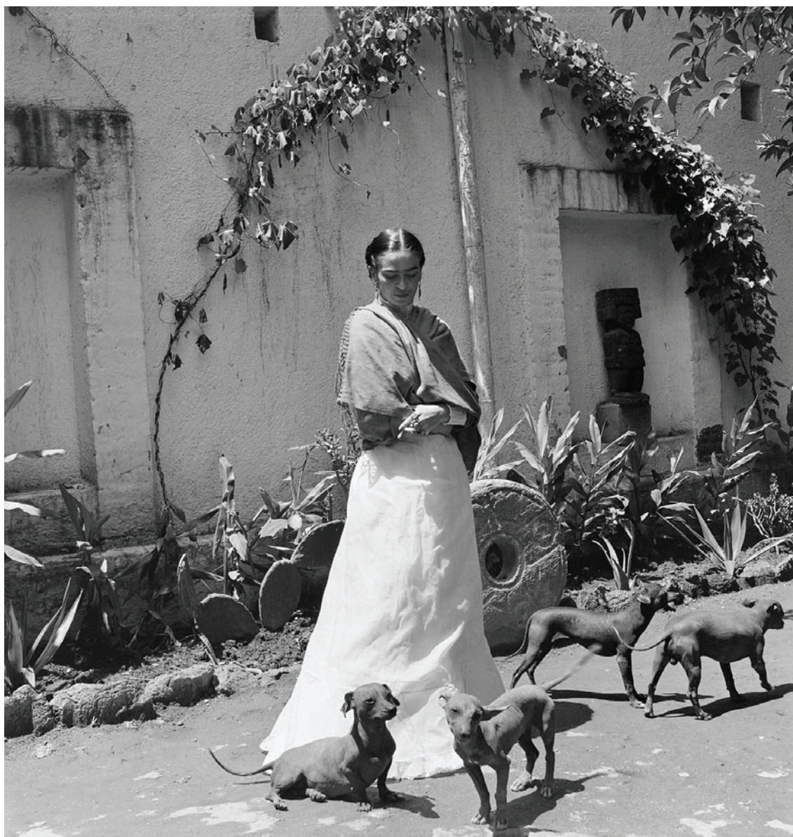
Image nr.3 Gisèle Freund, Frida Kahlo entourée de ses chiens à Coyoacán 35 . ©

Une photo de Lola Álvarez Bravo 36 datant de 1944, prise également dans le jardin de la Casa Azul , représente Frida de trois quarts, en plan américain, adossée à un arbre, dans une pose théâtrale, – semblable à une tragédienne –, les avant-bras repliés sur sa poitrine, les mains superposées au niveau du cou, comme pour signifier l'oppression. Les branches de l'arbre s'inscrivent dans le prolongement de ces avant-bras et dessinent une forme de X qui évoque la croix de Saint-André. Tout dans cette photo relève du symbolique et de l'allégorie : la gestuelle de Frida et la présence de l'arbre