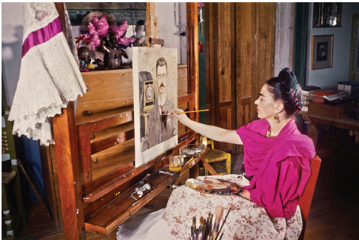
Image nr. 5 Gisèle Freund, Frida Kahlo faisant le portrait de son père photographe 42, 1951.

L'art de Gisèle Freund n'est donc pas réductible à une vision au féminin, il s'attache tout particulièrement à mettre en avant la figure de l'artiste peintre mexicaine et son univers familial. Le regard de Lola Álvarez Bravo et de Gisèle Freund, c'est avant tout le regard d'artistes qui s'intéressent à une autre artiste, Frida, au delà du paradigme du genre, l'une privilégiant la mise en scène spéculaire, et l'autre, le jeu de mise en abyme.