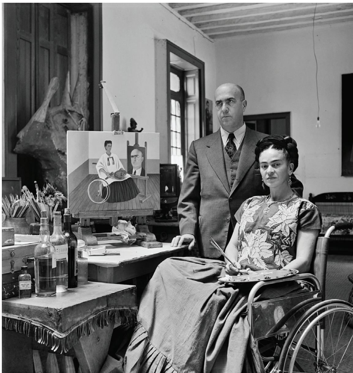
Image nr. 4 Gisèle Freund, Frida Kahlo et le Docteur Farill 41 , 1951. ©