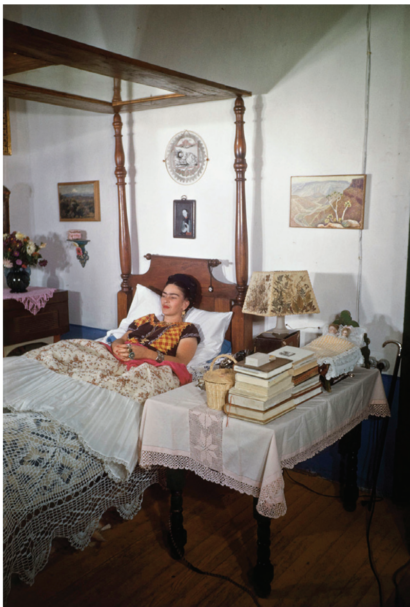
Image nr.2 Gisèle Freund, Frida Kahlo allongée sur son lit 31 , 1951. ©

Cette dualité ne se devine-t-elle pas aussi dans une autre image de Frida, celle de la femme « poupée » que semblent dévoiler certains de ses tableaux et de ses autoportraits, comme celui dédié à Trotsky, Autorretrato dedicado a León Trotsky de 1937 ? Sur la photo de Gisèle Freund de 1951, un parallèle peut être établi entre Frida Kahlo allongée sur son lit et les poupées qui décorent la table placée à côté d'elle et qui se trouvent, elles aussi, couchées dans leur petit lit, parallèle au sien. Par un jeu de mise en abyme et d'écho, Frida semble être assimilée à ces poupées qui, par ailleurs, seraient aussi à mettre en relation avec sa maternité frustrée.