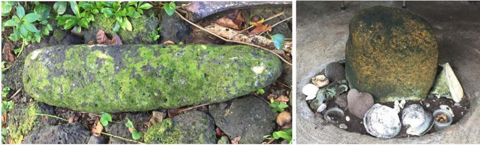
Figure 3 : (a) la pierre à poisson et (b) la pierre gardienne mentalement référencée dans le rāhui ( puna a'ahi , pierre à thon)