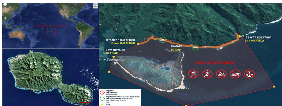
Figure 1 : Localisation géographique et règlementation de l'espace rāhui à Teahupo'o, Presqu'île de Tahiti, Polynésie française.