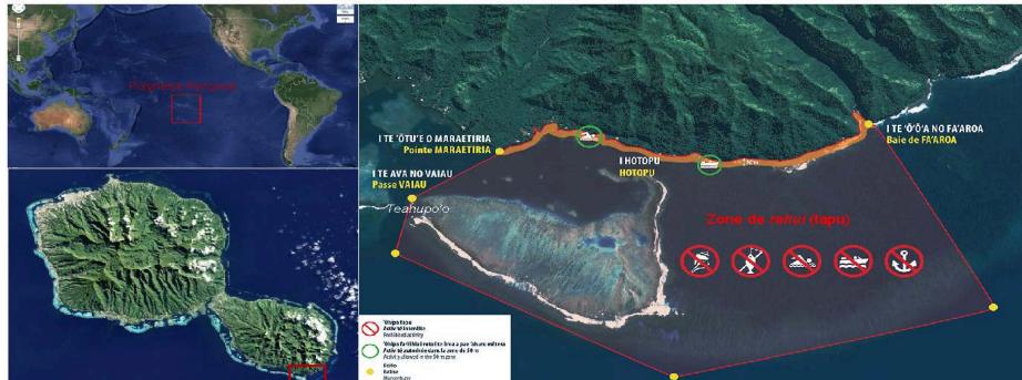
Figure 1 : Localisation géographique et règlementation de l'espace rāhui à Teahupo'o, Presqu'île de Tahiti, Polynésie française.