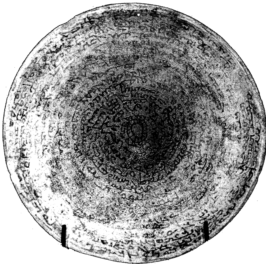
Coupe mandéenne d'Amkur