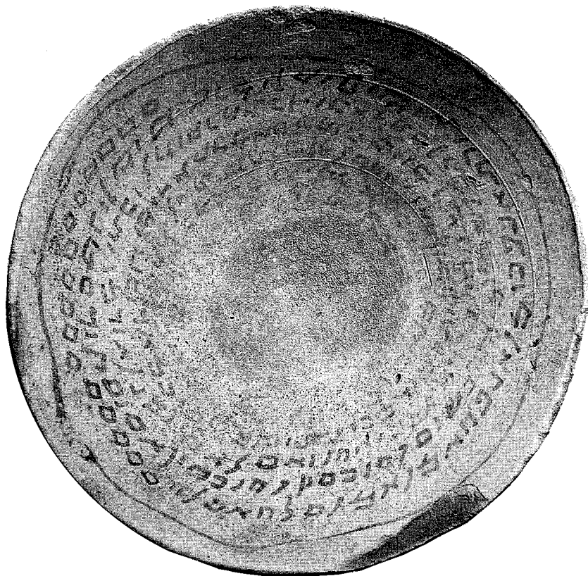
Coupe d'Abiu et d'Imma'î