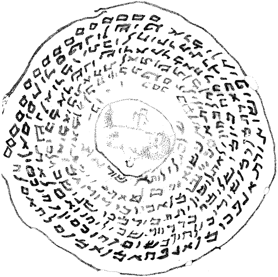
Fac-simile de la coupe d'Abtu et d'Imma'i