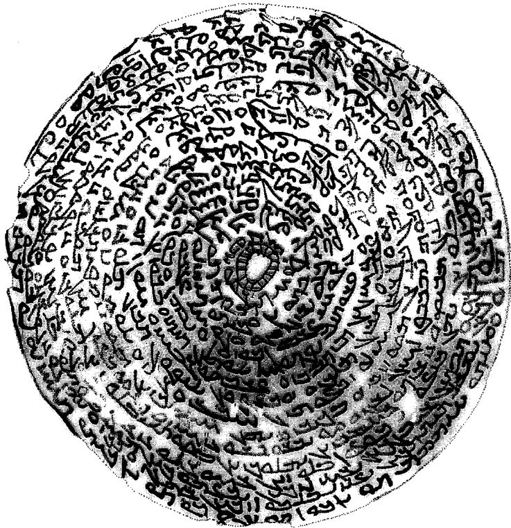
Fac-simile de la coupe d'Amkur