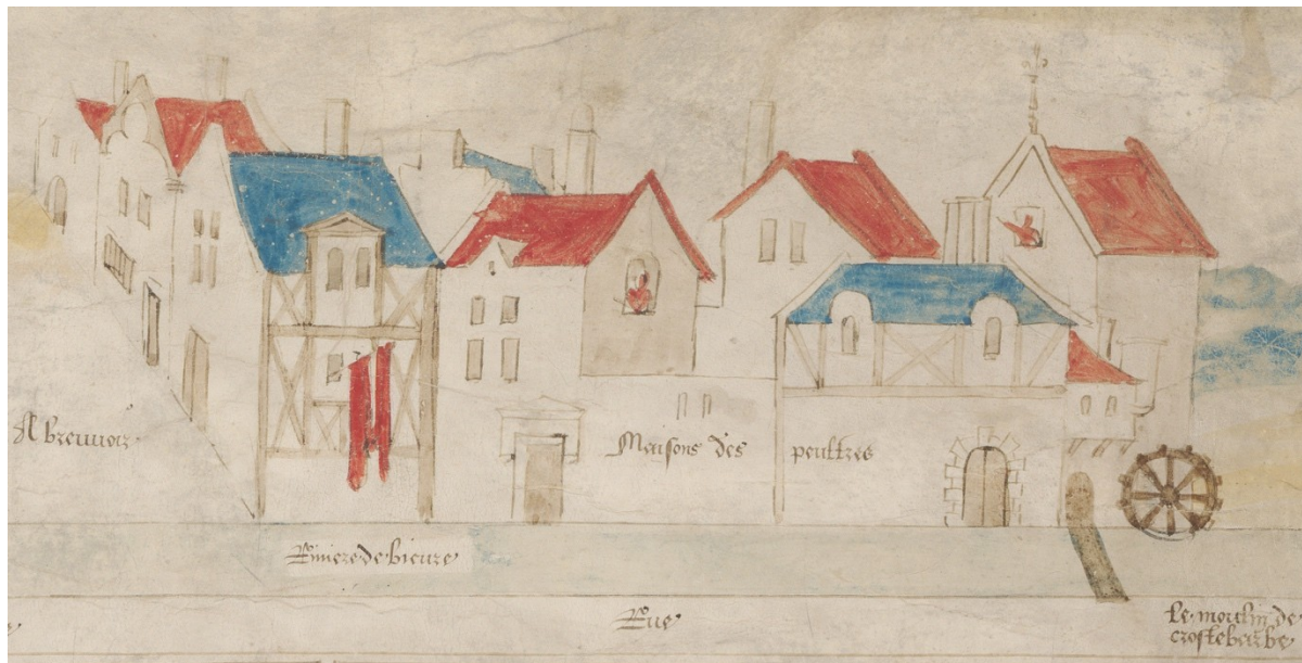
Figure 8. Le moulin de Croulebarbe au XVI e siècle. La représentation du moulin n'est pas