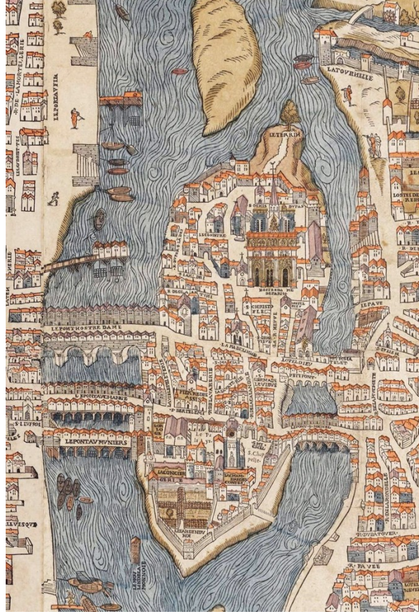
Figure 2. Les moulins de la Seine à Paris en 1553 sur le plan de Truschet et Hoyau. Le plan est orienté Est-Ouest avec le Nord à Gauche. La Seine avait grandement été libérée de ses moulins au XVI e siècle, mais il restait plusieurs groupes de moulins dans son bras Nord, notamment sous le Pont aux Meuniers. Au XIII e siècle, plusieurs pontons accueillant des moulins semblables à ceux représentés au-dessus du Pont Notre-Dame encombraient la Seine.