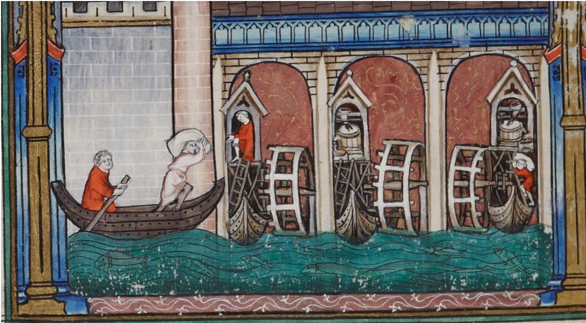
Figure 5. Cette image est la plus ancienne représentation des moulins tournant sous les arches des ponts de Paris. L'enlumineur s'est attaché à représenter fidèlement le mécanisme de transmission du mouvement sur le moulin de droite laissant apparaître les différents tournants et travaillants du moulin : la roue, l'arbre, le rouet et la lanterne qui renvoient le mouvement horizontal de la roue vers les meules, abritées dans un coffre de bois appelé archure. Une trémie, sorte de grande auge de bois dans lequel le blé était mis avant d'être moulu, déverse le grain dans les meules. Il est difficile de dire si les moulins reposent sur des bateaux ou si les bateaux sont seulement stationnés devant et permettent de transporter la farine comme semble le suggérer la représentation du personnage de droite. (Yves de Saint-Denis, Vie de saint Denis , Bibl. nat. Fr., Français 2092, fol. 37v).