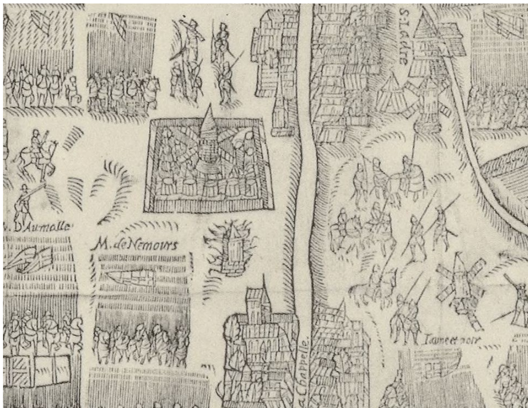
Figure 4. Un moulin à vent en flammes sur le plan de la bataille de Saint-Denis (1568). La bataille de Saint-Denis eut lieu le 10 novembre 1567 et opposa l'armée royale aux troupes protestantes qui campaient à Saint-Denis et avaient l'objectif d'affamer Paris. Elle eut lieu dans la plaine séparant Paris et Saint-Denis, où se trouvaient de nombreux moulins à vent transformant en farine le blé provenant de la plaine de France. Le plan montre que certains d'entre eux étaient fortifiés pour éviter les attaques. Le moulin situé en dessous est en revanche dévoré par les flammes. (« La bataille de Saint-Denis, le 10 novembre 1567 », extrait d'un manuscrit de Stéphanus VITELLIUS (fin du XVI e siècle), appartenant au fonds ancien de la médiathèque de Saint-Denis, S. D. Ms. E 1.).