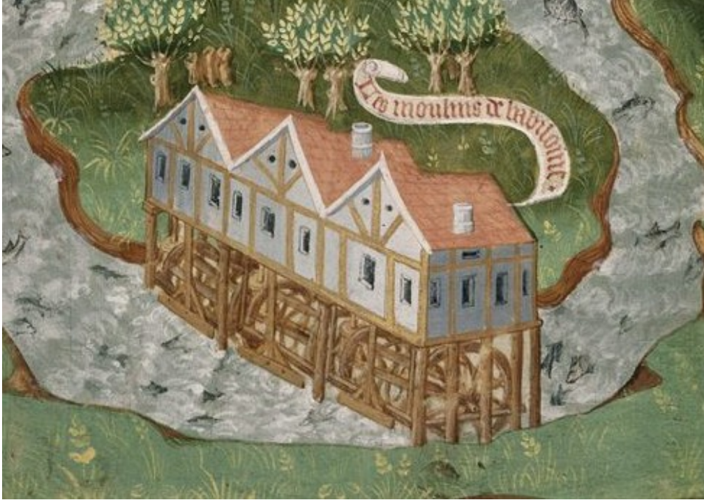
Figure 6. Les moulins de Babylone (1444-1445). L'enlumineur du Roman d'Alexandre s'est probablement inspiré des moulins du Pont aux Meuniers. Au XV e siècle, il s'agissait de moulins pendus assis sur des pilotis de bois. Le moulin est alors un lieu de vie pour le meunier qui peut ainsi le surveiller comme le montre la présence de cheminées. ( Roman d'Alexandre en prose, British Library, Royal MS 15 E VI, fol. 4,).