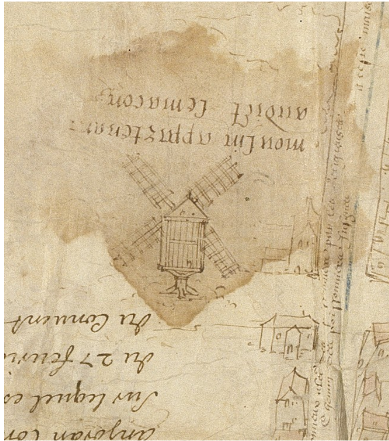
Figure 9. Un moulin sur pivot en 1559. La majorité des moulins à vent édiés à Paris au XVI e siècle, prenaient la forme du moulin sur pivot, consistant en une cage de bois reposant sur un pivot charpenté ou maçonné. L'escalier extérieur permettant d'accéder à la cage servait souvent à orienter le moulin. Certains moulins, comme celui-ci, avaient été installés sur des reliefs artificiels formés par l'accumulation de déchets (appelés gravois) afin de profiter d'une meilleure exposition au vent. (« Plan figuré et description du lieu appelé la Ville neufve sur Gravois », vue cavalière, Arch. nat. CP S 6626).

exempte de stylisation, la roue, très en hauteur, étant à peine immergée dans l'eau. (Plan du couvent des Cordelières Saint-Marcel, Arch. nat. CP S 4683).