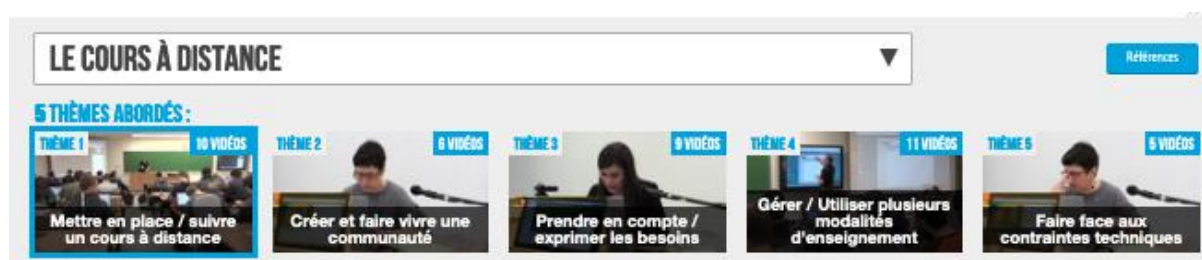
Image 2 : Capture d'écran de l'ENACTS- frise développée horizontalement

La scénarisation s'est poursuivie par l'agencement de ces capsules vidéo pour répondre le plus justement aux attentes des enseignants et des formateurs d'enseignants utilisant cet ENACTS en formation. L'intention de cette scénarisation médiatique est de présenter des possibilités d'intelligibilité, d'appropriation et de transformation des situations professionnelles en consultation autonome, mais également de permettre à un utilisateur (formateurs d'enseignants) de concevoir des scénarisations pédagogiques en animant le lien entre média, apprenants et objets de savoirs (Henri, Compte et Charlier, 2007). Les données vidéos ont été scénarisées et agencées par « situation professionnelle » et au sein de chaque situation professionnelle des thèmes ont été identifiés. Les situations professionnelles définies étaient à la fois des situations archétypiques de l'enseignement à l'université (CM, TD) et à la fois des situations montrant des transformations d'expériences ou des modalités plus « innovantes » d'enseignement qui se développent ces dernières années dans les établissements d'enseignement supérieur (classe inversée, cours magistral interactif). Dans chaque situation professionnelle, l'utilisateur est confronté à plusieurs thèmes à travers une frise développée horizontalement. Ces thèmes sont énoncés par des verbes d'actions évoquant l'activité et/ou les préoccupations conjointes et simultanées des enseignants et des étudiants.