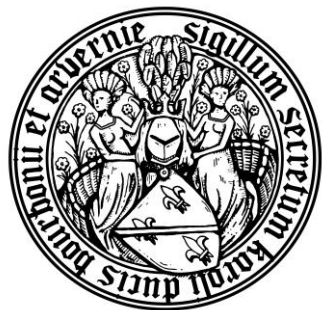
10. Quatrième sceau de Charles (1435-1443)