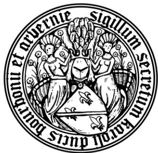
10. Quatrième sceau de Charles (1435-1443)