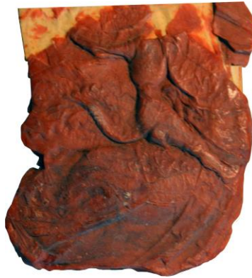
6. Deuxième sceau de Charles (fin des années 1420 à 1433)