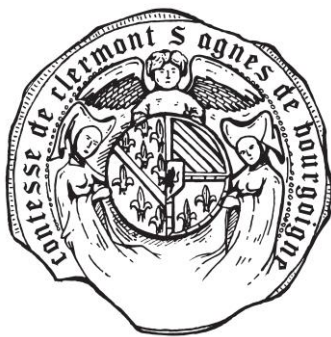
3. Premier sceau d'Agnès (années 1420)