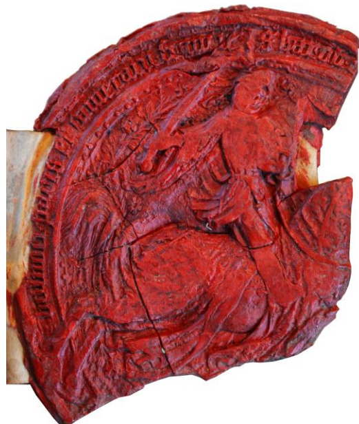
2. Grand sceau équestre de Charles I er (troisième sceau) AD Côte-d'Or, B 281, PS 110, 4 déc. 1434