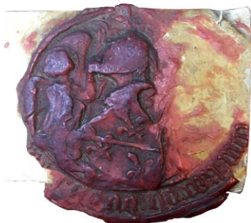
12. Cinquième sceau de Charles (1444)