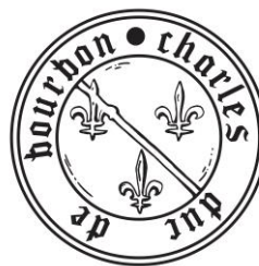
11. Contre-sceau du quatrième sceau