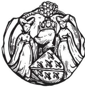
5. Premier sceau de Charles (milieu des années 1420)