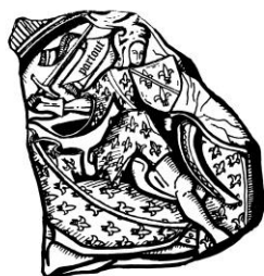
15. Huitième sceau de Charles (1454)