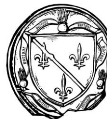
16. Contre-sceau du huitième sceau de Charles