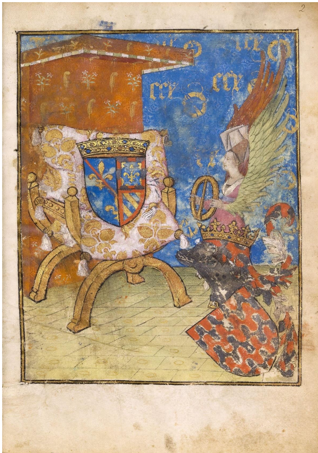
17. ( 1 re de couverture ) Antoine de La Sale, Le Paradis de la reine Sibylle Chantilly, Bibliothèque du Musée Condé, ms 653, fol. 2.