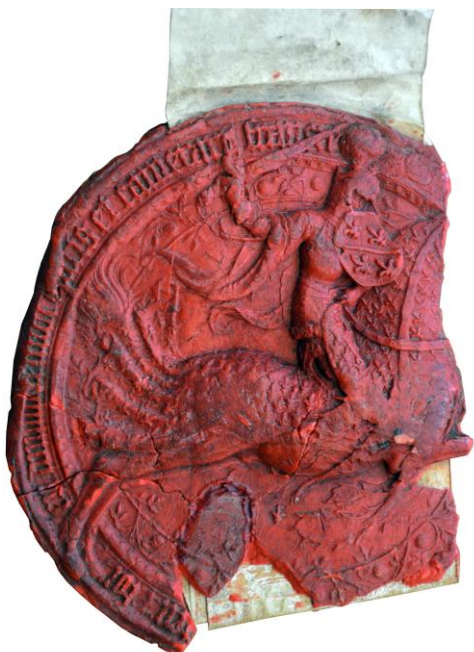
1. Grand sceau équestre de Jean I er de Bourbon AD Côte-d'Or, B 11915, 31 août 1415