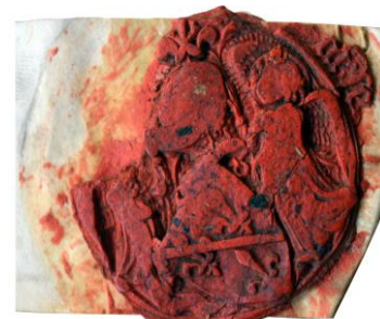
14. Septième sceau de Charles (1445)