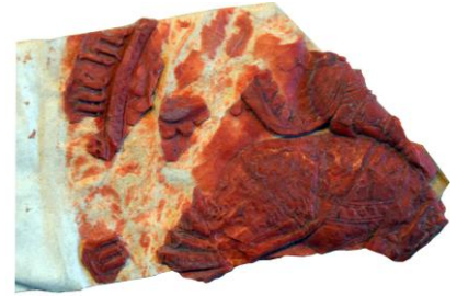
7. Deuxième sceau de Charles (seconde empreinte)