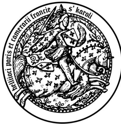
8. Troisième sceau de Charles (1434-1439)