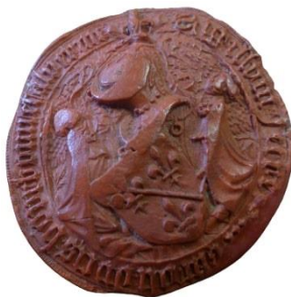
13. Sixième sceau de Charles (1444)