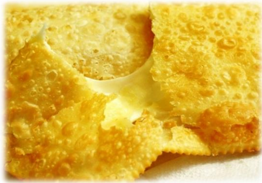
Pastel au fromage (fig.2)

L'image perçue des brésiliens à l'étranger relève bien souvent d'une société du culte du corps, de personnes qui passent des heures dans les salles de gym et qui réalisent d'importantes dépenses en chirurgie plastique et en cosmétique dont le Brésil est effectivement un des premiers marchés au monde 1 . Au-delà des idées reçues, il est bien vrai que les brésiliens se préoccupent, au quotidien, de leur forme et de la beauté de leur corps, et notamment les femmes brésiliennes (Strehlau, Claro et Laban Neto, 2015). Dans ce contexte, l'alimentation joue un rôle essentiel. Mais, que mangent vraiment les brésiliens et brésiliennes ? Est-ce vraiment adapté pour atteindre cet idéal esthétique ? Si l'alimentation traditionnelle brésilienne se devait d'être très saine, l'offre du commerce, de la restauration rapide, des supermarchés et de la distribution spécialisée est, quant à elle, principalement constituée, au contraire, de produits peu sains. Par exemple, les plats gras et copieux, et pas très équilibrés en nutriments sont toujours présents que ce soit à la maison ou à l'extérieur des foyers. Les repas peuvent être, parfois, remplacés par des en-cas frits, tels que les « coxinhas 2 (voir fig. 2) » et les « pastel 3 (voir fig. 3).