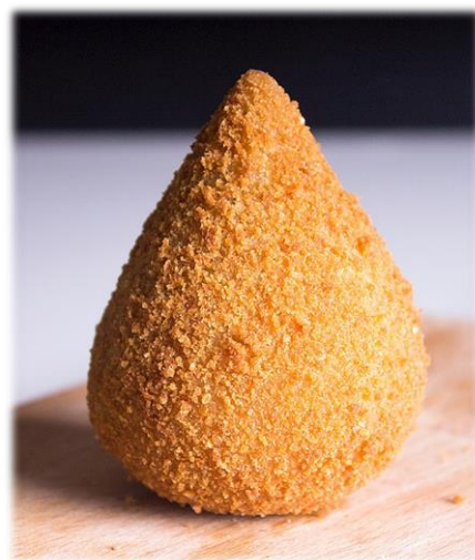
Coxinha farcie au poulet (fig.3)

Depuis quelques années, en même temps que le pouvoir d'achat augmentait dans les zones les plus développées du pays, les adultes brésiliens, sans s'en rendre trop compte, et sont devenus de plus en