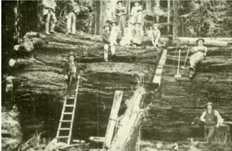
Figure 1 : Parc Stanley, Vancouver : 1886.

Sous d'autres cieux, après la révolution industrielle, l'homme recherchait des loisirs, des lieux de relaxation et de divertissement. C'est ainsi que vers les années 1870 les parcs ont vu le jour « Parc Stanley, Vancouver (1886); High Park, Toronto (1873) ; Parc Mont-Royal, Montréal (1876) ; Parc des Champs-de-Bataille, ville de Québec (1907) ; Parc Point Pleasant, Halifax (1866) ; Parc Bowring, St. John's (1914)» (Rosen, 2016).