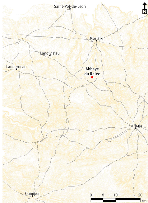
3 Les grands itinéraires routiers reliés à l'abbaye du Relec