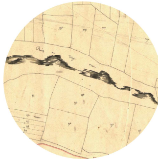
2 Expression du relief des Monts d'Arrée dans le figuré du cadastre napoléonien