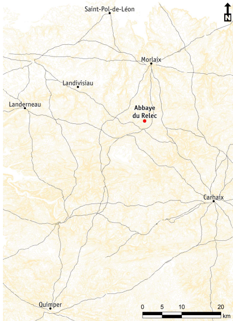
3 Les grands itinéraires routiers reliés à l'abbaye du Relec