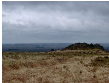
1 Les Monts d'Arrée