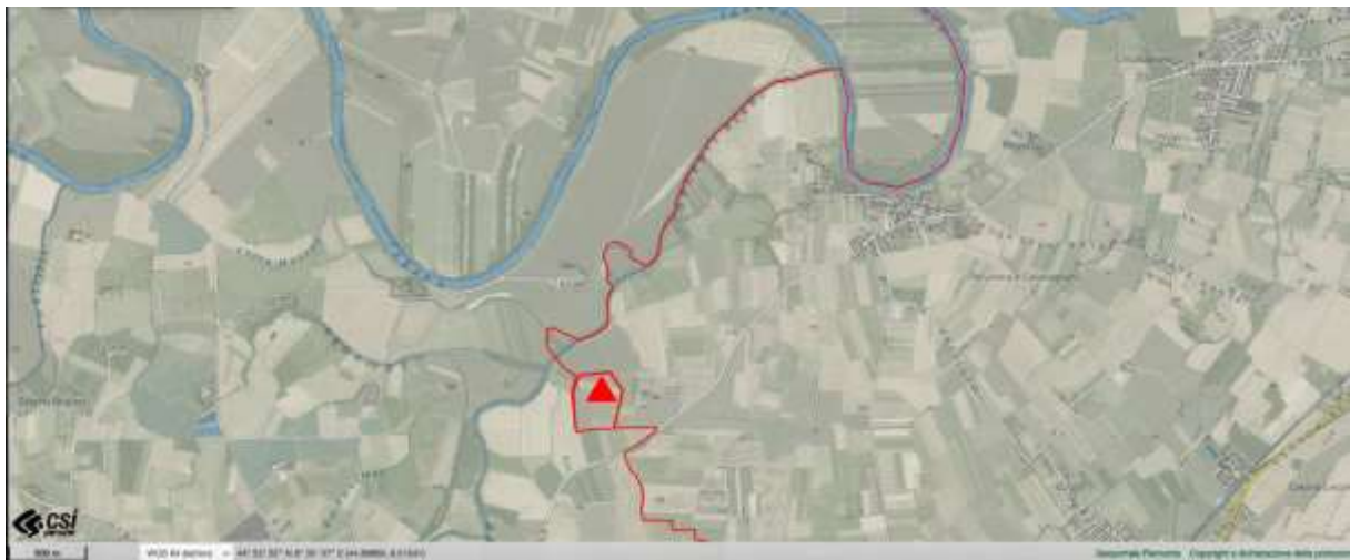
Fig. 1 Villa del Foro, Alexandrie, Piémont, Italie du Nord. Photo ©Geoportale Piemonte, élaboration V. Cicolani.

Au cours de l'automne 2021, des prospections géophysiques ont pu être organisées en Italie du Nord ciblant un site archéologique majeur pour l'études des agglomérations préromaines : l'habitat à vocation artisanale de Villa del Foro (fig. 1).