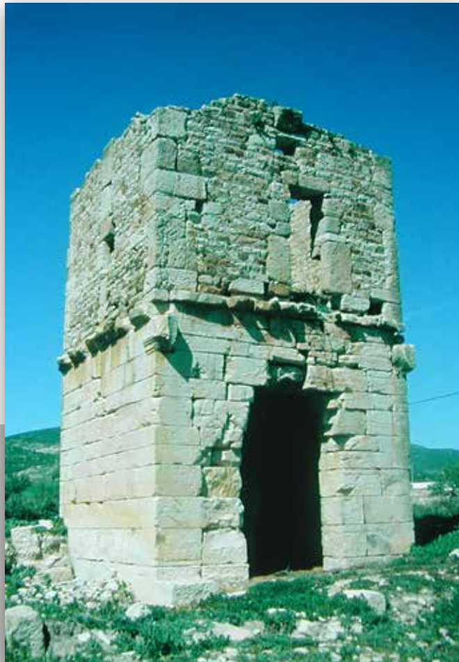
Mausolée de Kasr Faouara transformé en poste de guet à l'époque byzantine

Sur le territoire, quelques édifices ont déjà été repérés, en particulier deux superbes mausolées, ainsi que la carrière de calcaire qui était exploitée dans l'Antiquité, mais également un fortin ancien et des types de constructions traditionnels. Ces mausolées monumentaux de style classique, datables du haut empire romain, témoignent de la présence de grands domaines, dont certains étaient probablement en possession de dignitaires de citoyenneté romaine