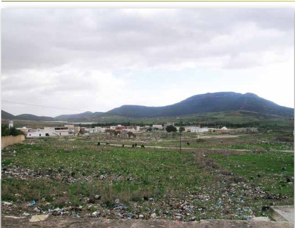
Site et village d'Aïn Tébourouk

Un programme se donnant de tels objectifs doit s'articuler autour de trois axes principaux. Le premier porte sur l'acquisition de connaissances intéressant tant le site archéologique que le territoire et, dans ce dernier cas, l'attention doit se porter tant sur les éléments naturels que sur les interventions humaines, passées et présentes, sur les modes de production et les savoirs de la population. Le second axe correspond aux échanges et donc à la transmission des acquis et des compétences des experts. Le troisième axe est celui de la pérennisation de l'expérience à travers l'élaboration d'un projet territorial et la réalisation d'actions de valorisation concrètes. Dans l'idéal ces trois axes ne devraient pas se succéder dans le temps, mais se croiser et se conjuguer.