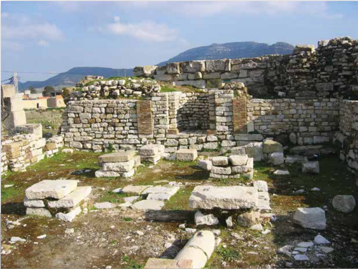
La mosquée de Téournouk dans sa dernière phase d'occupation

L'agglomération traverse les siècles en se transformant. Des constructions attestent de sa vitalité au Moyen Âge, mais un peu plus tard elle est abandonnée, puis réoccupée à l'époque moderne : des maisons andalouses et une transformation de la mosquée en témoignent. Si, à ce jour, des habitations d'époques diverses ont été entrevues, les vestiges les plus compréhensibles appartiennent probablement à cette phase andalouse de l'occupation du site ; ils sont situés sur la limite occidentale de l'espace dégagé.