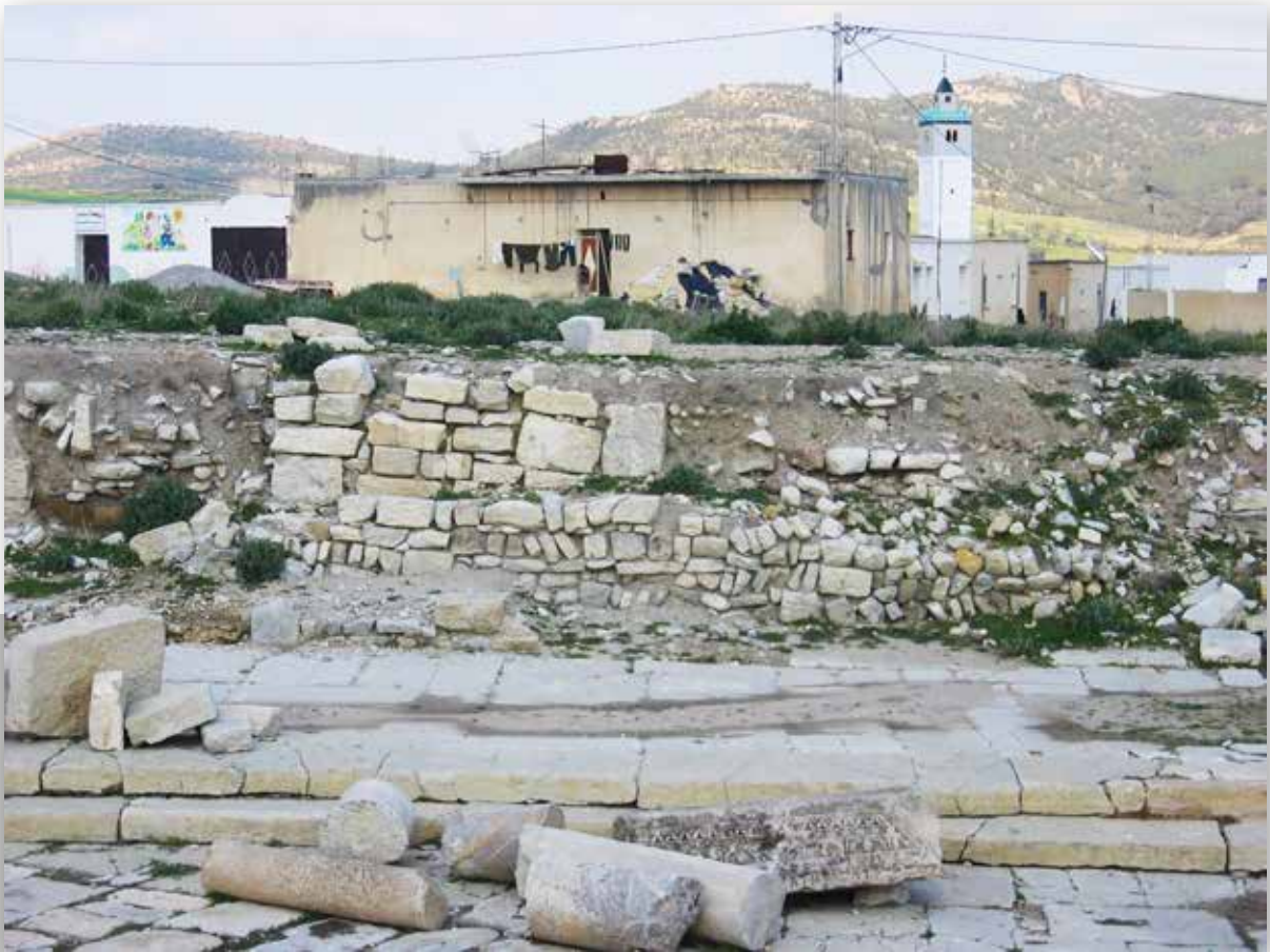
La mosquée de Tébourouk dans sa dernière phase d'occupation