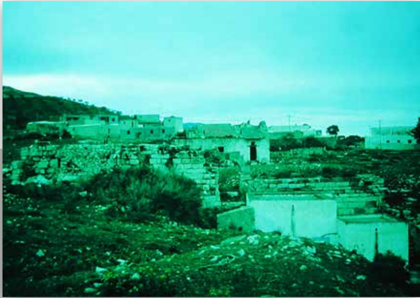
Tubernuc en 1995 avant les travaux de réhabilitation

La prise en charge effective du site par l'institut national du Patrimoine date du milieu des années 1990. Cette mission, confiée à Taher Ghalia pendant une décennie, a permis la réalisation d'importants travaux de réhabilitation des principaux monuments du site, réétudiés selon une nouvelle dynamique de recherche impliquant des partenaires provenant d'horizons disciplinaires différents et complémentaires. Des mesures de conservation ont été prises avec la mise en place d'un plan de délimitation de la zone archéologique non aedificandi qui fut dotée d'une clôture et d'une structure d'accueil placée en amont du site.