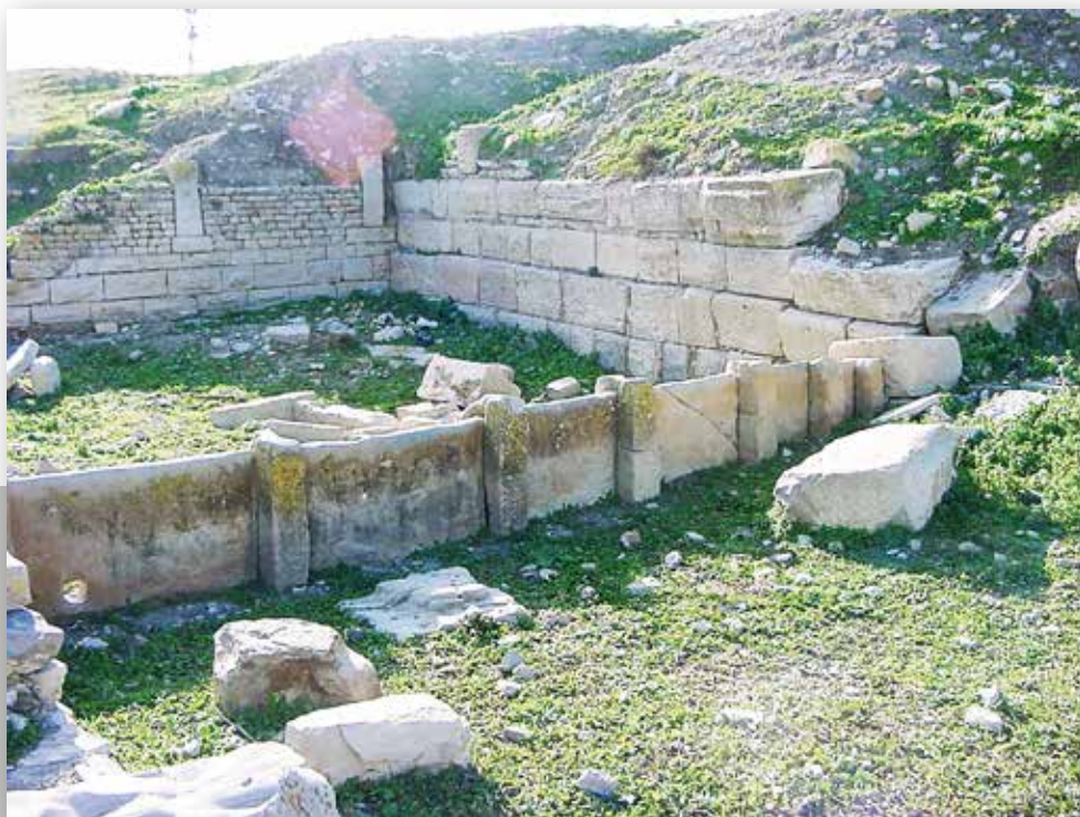
Le nymphée romain de Tubernuc