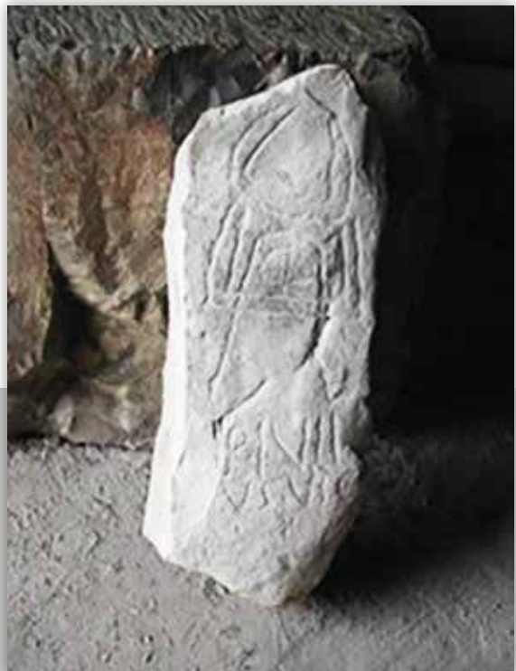
Stèle votive du sanctuaire de Saturne de Tubernuc

Tubernuc est à l'origine une bourgade rurale autochtone de culture libyco punique comme l'indique le toponyme qui a été conservé à l'époque romaine et l'existence d'un sanctuaire néo-punique dédié à Saturne, l'héritier de Baal, révélée par la présence de stèles votives.