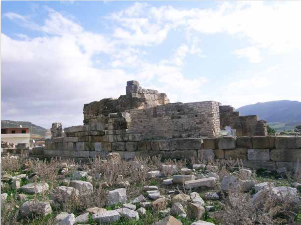
Alignement du mur nord de la forteresse byzantine

Entre le IX e et le XI e siècle – les fouilles devront fixer plus précisément cette date -, dans l'angle sud-ouest de la citadelle byzantine, aux abords de l'ancien forum, s'installe un ensemble culturel composé d'une cour, d'une salle de prière hypostyle à coupole centrale, d'un portique. Le mihrab est aménagé dans le mur de la citadelle au pied de la tour sud-ouest, qui a certainement servi de minaret. Divers indices laissent entrevoir pour le moins deux moments importants dans la vie de cette mosquée. Au premier, datant du Moyen Âge, correspond une entrée latérale qui fut reliée au pavement du forum par un escalier dont les vestiges, encore visibles, attestent son appartenance à un édifice préexistant, éventuellement une ancienne chapelle chrétienne transformée pour servir de lieu de culte islamique. Le deuxième moment date de la période moderne : la salle de prière dont l'entrée avait été placée dans l'axe du mihrab, reçoit alors un pavage de briques. Les murs de l'oratoire conservent des parements en briques induisant la présence de voûtes croisées tout au moins dans les bas-côtés de l'oratoire. Une inscription funéraire conservée au musée national du Bardo, témoigne de la présence au XI e siècle d'une communauté chiite réfugiée à Tébournouk après le départ des fatimides de Tunisie.