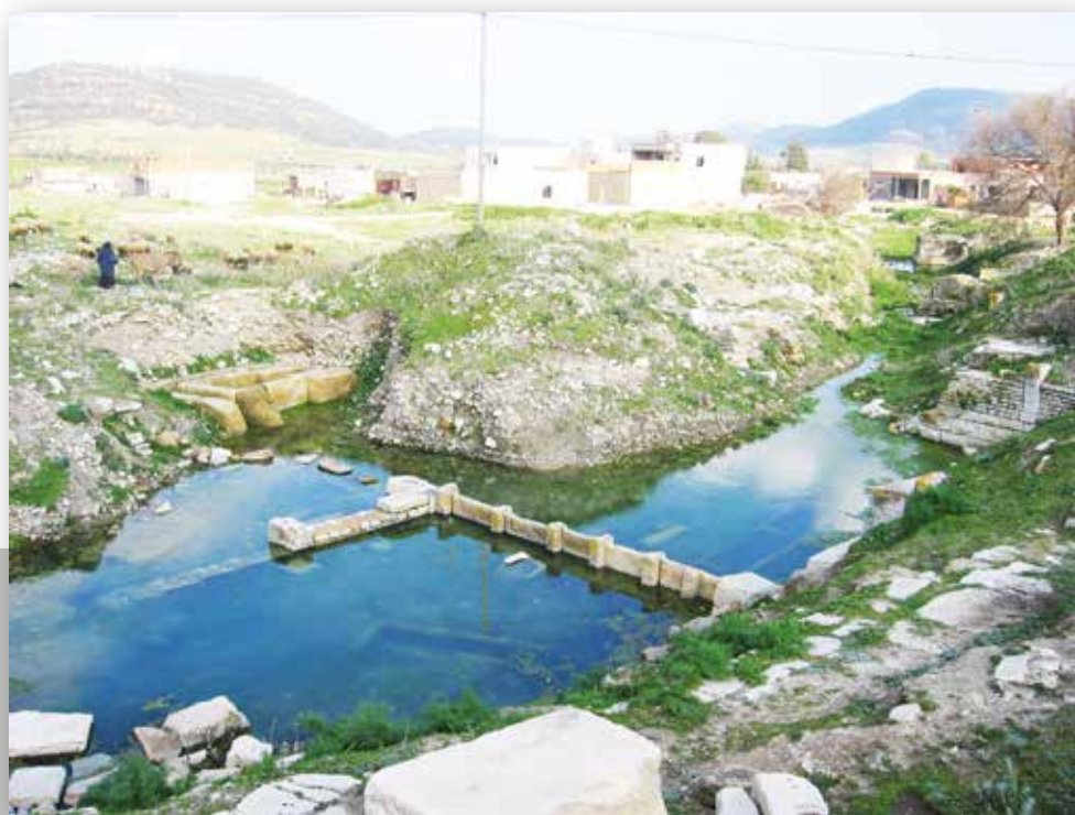
Le secteur des installations hydrauliques du site en mars 2005