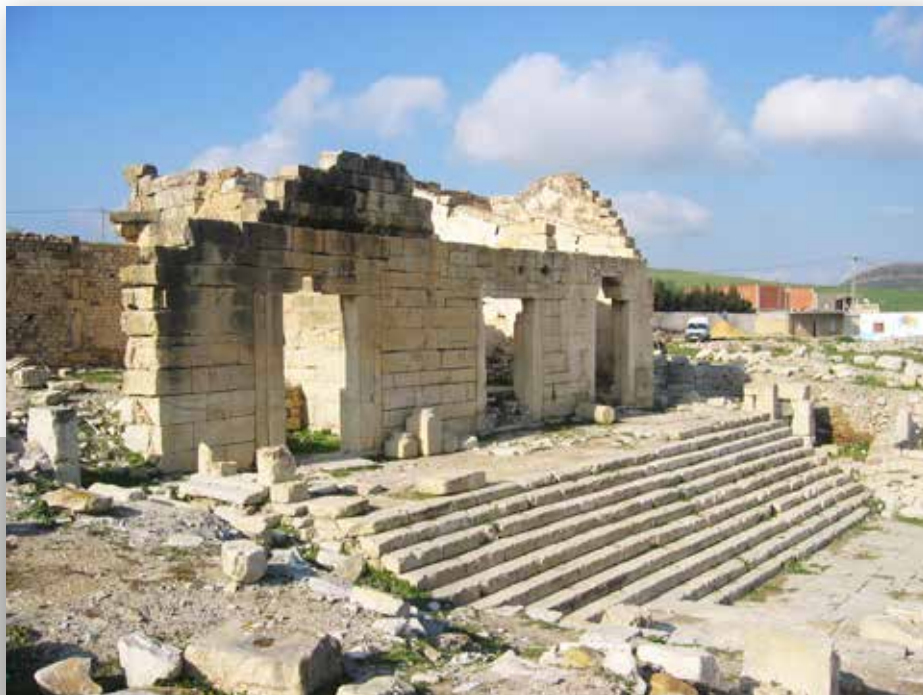
Le monument public de Tubernuc

Sur l'un des côtés du forum se dresse un bâtiment dont la fonction est encore incertaine. Il est précédé par un escalier de façade comptant dix marches conduisant à un portique à neuf colonnes, qui longe les trois salles voutées de profondeur variable ayant des entrées axiales parfaitement alignées.