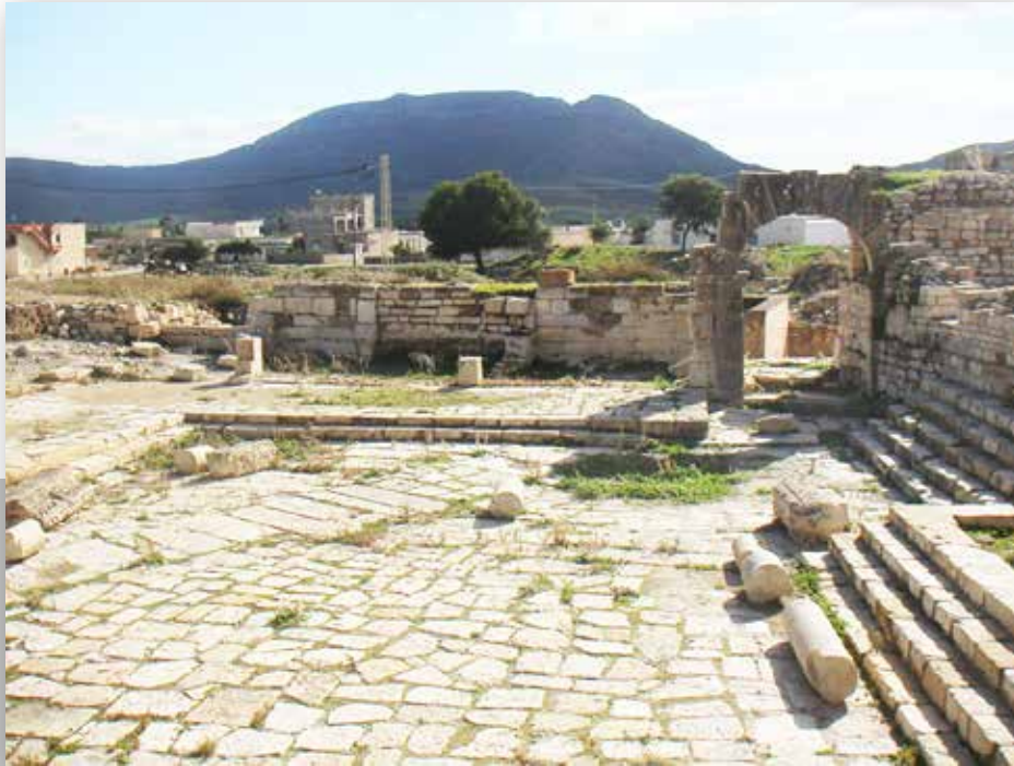
Le forum de Tubernuc

Sur l'un des côtés du forum se dresse un bâtiment dont la fonction est encore incertaine. Il est précédé par un escalier de façade comptant dix marches conduisant à un portique à neuf colonnes, qui longe les trois salles voutées de profondeur variable ayant des entrées axiales parfaitement alignées.