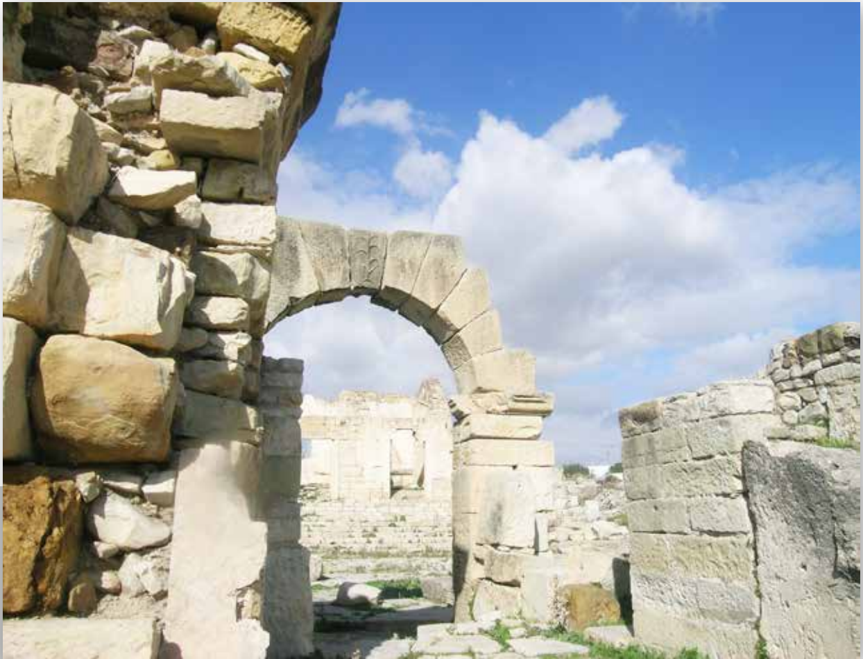
L'arc d'entrée du forum offert par les leontii