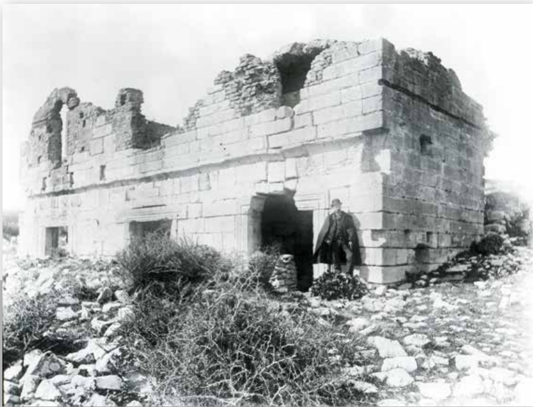
La curie de Tubernac en 1892

De plan atypique, il a été longtemps considéré comme le capitole de la cité. Toutefois la présence de larges fenêtres axiales dans les trois salles, induit la présence d'un édifice civil accessible au public. C'est probablement la curie de la cité, dont le statut municipal a été obtenu au Haut Empire, ainsi que nous l'apprend une l'inscription découverte sur le site.