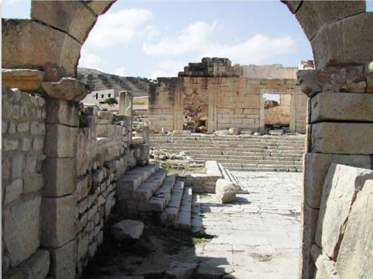
Vue du forum de Tubernuc

L'agglomération est donc certainement antérieure à l'arrivée des Romains, qui cependant s'y installèrent très tôt. Leur influence se manifeste tant dans la création d'un réseau de rues relativement régulier, que par des aménagements et des édifices caractéristiques, tels que les ensembles thermaux dont l'un est daté du Ier siècle. Au cœur de l'habitat s'ouvre une place, qui était vraisemblablement le forum. On y accède par des escaliers qui partent du canyon de la source.